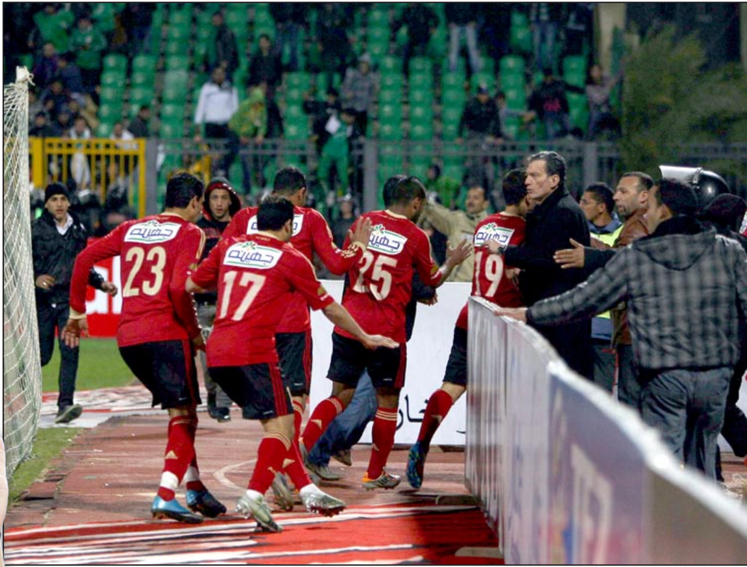
جانب من أحداث ملعب بورسعيد

اللقوات تقول إن مباريات البطولة يجب أن تقام على أربعة ملاعب مختلفة، إذا أقيمت البطولة بالتنظيم المشترك، يمكن للدول الصغيرة أيضا تضيف البطولة". وفسر حياتو السبب في إقامة البطولة كل عامين قائلا: نصر على ذلك عمدا من أجل تحسين البنية الأساسية في كل أنحاء