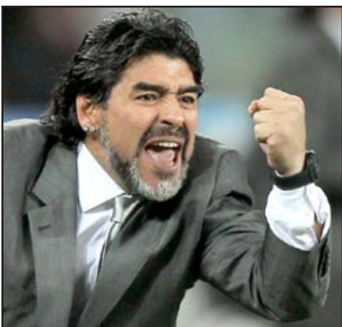
مارادونا يرفض أي عرض لتدريب للمنتخب الانكليزي

منذ بطولة كأس العالم ١٩٨٦، وأبدي مارادونا سعادته بلاعب الوصل بعد فوزهم على فريق بني ياس ١ - صفر في المرحلة الثالثة عشرة من الدوري الإماراتي. وقال: فريقي كان الأفضل واستحققت الثلاث نقاط، كل اللاعبين قدموا أداء جيدا خاصة أوليغيرا، يسعدني أن مررنا لم يستقبل أي هدف وهذا يعطينا الأمل لأداء أفضل في المستقبل، وهدد مارادونا قبل أيام بالرحيل عن الوصل الموسم المقبل إذا لم توضع بتصرفه ميزانية ضخمة لشراء لاعبين جدد.