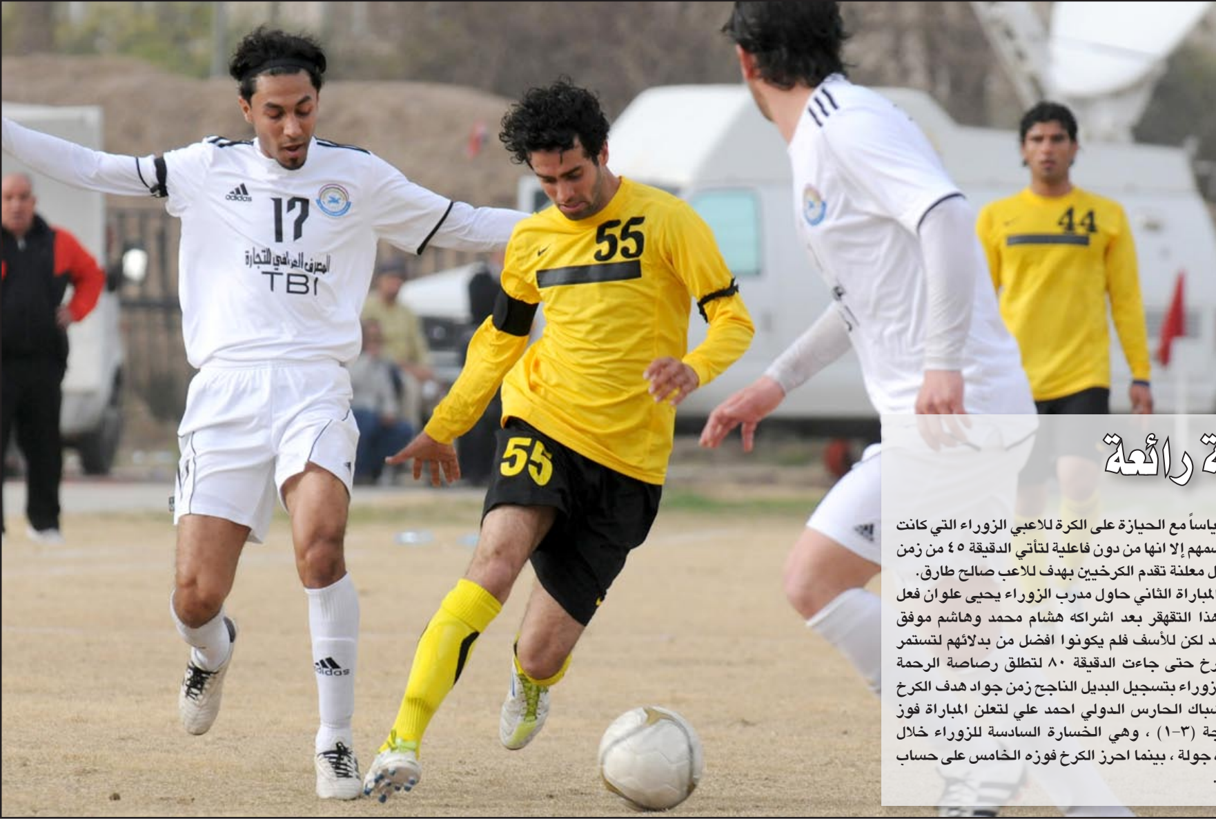
الكركخ يفاجيء الزوراء بفوز مستحق