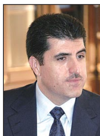
نيجيرفان بارزاني والتي تشغل ٥٩ مقعداً. وقالت سوزان شهاب رئيسة الكتلة الكردستانية في برلمان الإقليم، انه كان متوقعا أن تقاطع كتل

وقال الدكتور ارسلان بايز في أول حديث له بعد انتخابه رئيساً جديداً لبرلمان الإقليم: خلال الدورات البرلمانية الثلاث ووفقاً للمستجدات التي رافقت هذه الدورات كان للبرلمان مهام وواجبات شتى، لكن تلك الدورات المتعاقبة كانت منتمية لبعضها البعض، مضيفاً: تعتبر الدورة الأولى في البرلمان ونقوم بواجبنا كتكتل معارضة، وسنعارض القرارات التي لا تتناسب و مصالح المواطنين". وكان رئيس برلمان كردستان الجديد ارسلان بايز قد وجه دعوة إلى قوى المعارضة للحوار والتعاون. من جانبه أكد طارق جوهر المستشار الإعلامي لرئاسة برلمان كردستان، أنه في المرحلة القادمة سوف يلتقي رئيس إقليم كردستان مسعود بارزاني المرشحين لرئاسة الحكومة، وتكليفهم رسمياً بتشكيل حكومة الإقليم وفقاً للقانون.