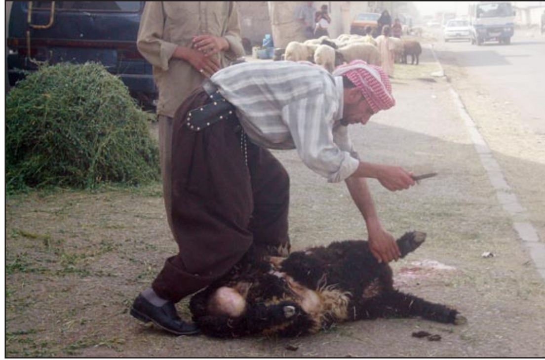
انتشار ملحوظ لذبح غير صحي للمواشي...