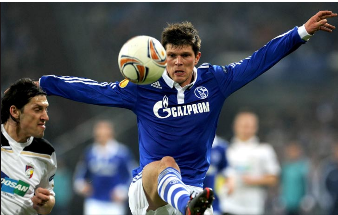
بايرن ميونيخ يواجه شالكة تحت الضغط النفسي

تعدّ الجولة ٢٣ من منافسات "البوندسليغا" التي انطلقت مبارياتها رسميا امس الجمعة وتنتهي مساء غد الأحد جولة غير "تقليدية" وقوية جدا لأنها ستجمع الأندية المتصدرة الكبيرة في مواجهات "ساخنة" لا يتوقع احد مسبقا النتائج التي ستمتخض عنها هذه المواجهات لاسيما منها المواجهة التي جرت مساء امس الجمعة والتي جمعت بروسيا منشغلادباخ ثاني الترتيب العام برصيد ٤٦ نقطة وهامبورغ صاحب المركز الحادي عشر برصيد ٢٦ نقطة. وتقام اليوم السبت ست مباريات مهمة اخرى ستحدد نتائجها تسلسل الأندية التي تحتل مراكز الثلث الثاني من قائمة الترتيب العام ومنها المباراة التي ستجمع نادي ليفركوزن سادس الترتيب العام برصيد ٣٤ نقطة الذي سيلعب هذه المباراة خارج ارضه ويعدا عن جمهوره حيث يلتقي نادي كولون صاحب المركز الرابع عشر برصيد ٢٤ نقطة فيها وتعد المباراة فرصة لبايرن ليفركوزن لتحسين صورته امام جمهوره واستعادة ماقده في هذه المرحلة من منافسات "البوندسليغا" ونفض غبار خسارته امام برشلونة الإسباني في دور الثمانية لبطولة دوري الأبطال ، واما كولون فهو الأخرى يبحث في هذه المباراة عن فوز كبير على احد الأندية المتصدرة وانزاع نقاط المباراة التي ستبعده عن مراكز الخطر قبل اكثر من شهرين من اختتام هذا الموسم! ومن جهته يحاول شتوتغارت تاسع الترتيب العام برصيد ٢٦ نقطة تجاوز أزمته الخائفة وهو يضيف على ارضه وامام انظار جمهوره نادي فرايبورغ تاسع متذلل الترتيب العام برصيد ١٦ نقطة الذي يقا تل من اجل البقاء في