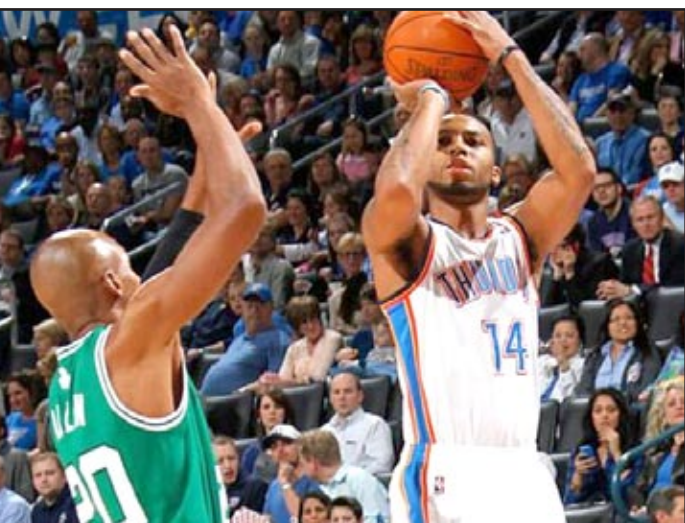
أوكلاهوما يعتمّق جراح بوسطن

□ واشنطن / أف ب واصل أوكلاهوما سيتي ثاندر تألقه على ملعبه هذا الموسم، بتغلبه على ضيفه بوسطن سلتيكس (١١٩-١٠٤) ، ضمن منافسات الدوري الأمريكي للمحترفين في كرة السلة. وفي صالة "شيزابيك إينرجي أرينا" أمام ١٩٢٠٣ متفرجين، عمق أوكلاهوما جراح ضيفه بوسطن، وألحق به الهزيمة الخامسة على التوالي، والسابعة عشرة هذا الموسم، محققا بدوره فوزه الحادي عشر على التوالي بين جمهوره، والرابع على التوالي بالمجم، والسادس والعشرين في ٣٢ مباراة حتى الآن، فلقح بيمامي هيت إلى صدارة المنطقة الشرقية والدوري.