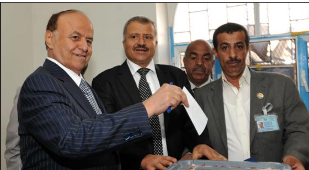
هادي يدي بصوته في الانتخابات الأخيرة

أن يحضره صالح، الذي غادر البلاد الشهر الماضي، في رحلة علاجية إلى الولايات المتحدة.