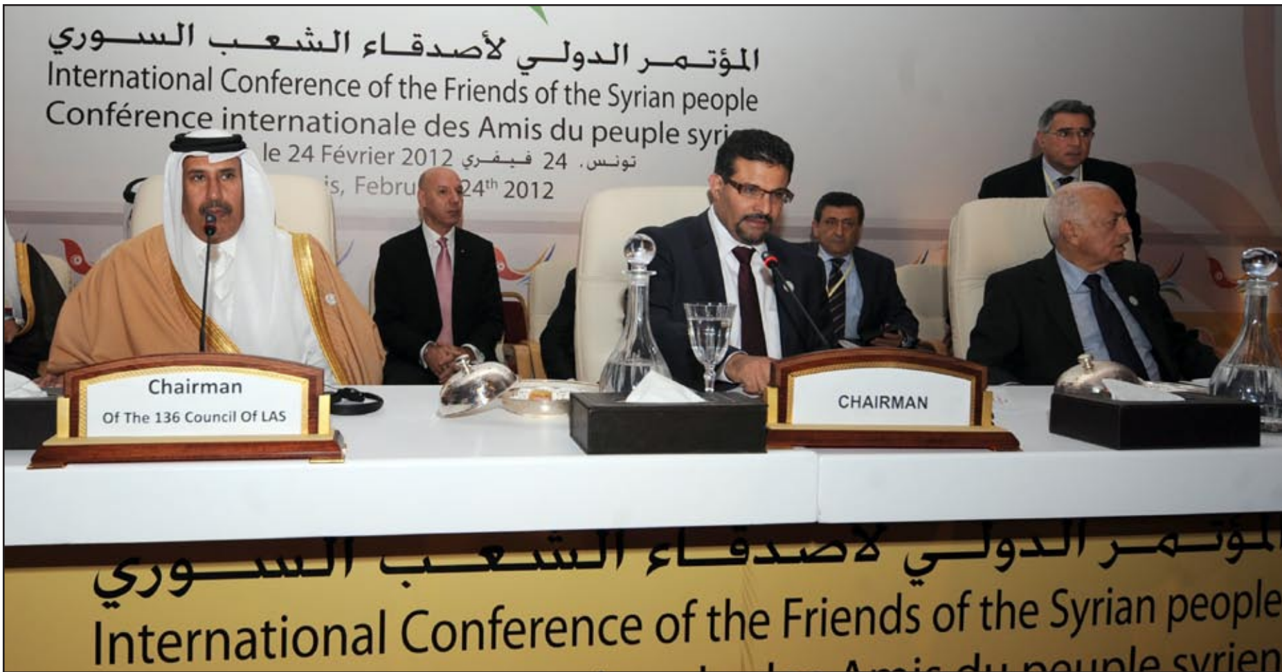
"أصدقاء سوريا" أول مؤتمر في تونس... إرشيف

سوريا على حافة الهاوية، قلنا ذلك منذ شهور، ونعيده اليوم ونحن نرتقب انزلقها المستمر، ونرتب الصراع عليها وفيها بعين المشفق على شعبها، ولا نملك غير القول حمى الله سوريا وشعبها، ولكن بطريقة مختلفة عن أهزوجة نظامها القائلة: سوريا الله حامياها.. الخ.