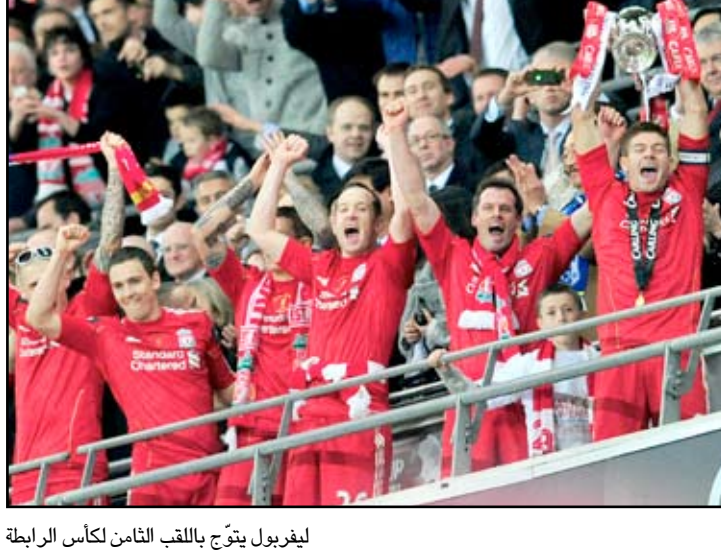
ليفربول يتوّج باللقب الثامن لكأس الرابطة

انكلترا على حساب وست هام. ويمكليفربول فرصة إحراز الثنائية في مسابقات الكؤوس المحلية لأنه بلغ الدور ربع النهائي أيضاً من كأس انكلترا حيث يلتقي ستوك سيتي. وفاجأ كارديف سيتي ضيفه ليفربول الأقوى منه والأكثر خبرة والقباه عندما افتتح التسجيل بواسطة جو مايسون الذي استغل تمريرة بينية رائعة ليسجل داخل شباك الحارس الإسباني خوسيه مانويل رينا (١٨). وحاول ليفربول جاهداً إدراك التعادل لكنه اصطدم بدفاع منظم وصلب سد جميع المنافذ المؤدية إلى المرمى فلم ينجح في ذلك في الشوط الأول على الرغم من محاولاته المتكررة. وفي الشوط الثاني استغل المدافع مارتن