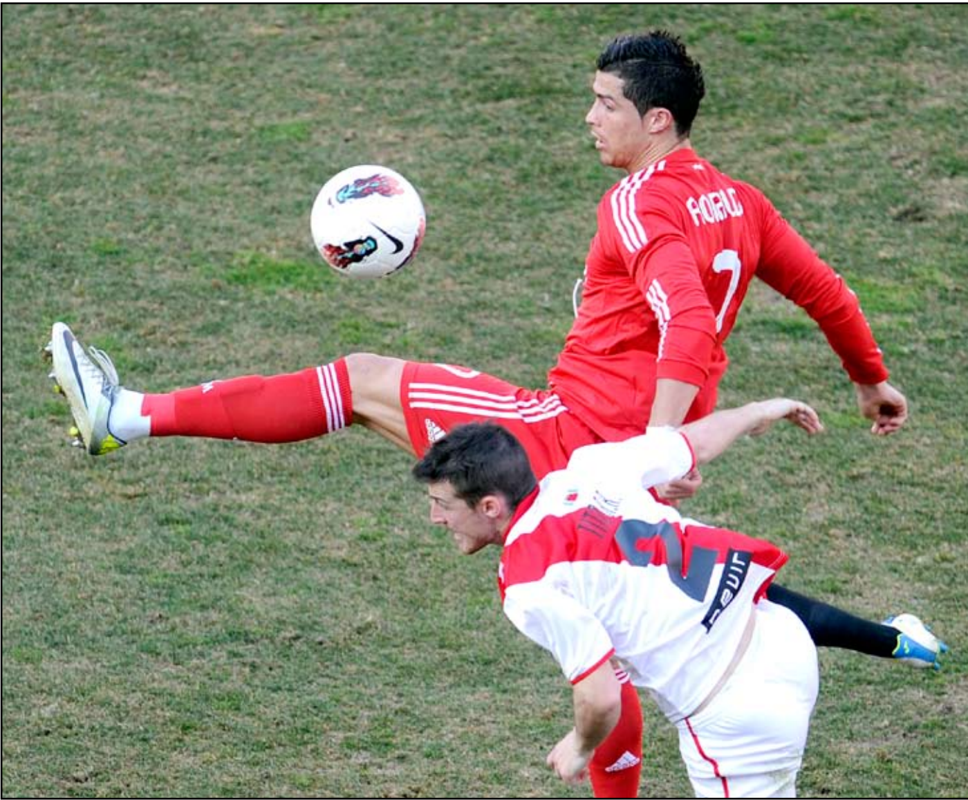
كريستيان رونالدو يقود الريال إلى فوز ثمين

وفي الشوط الثاني، أدرك أتلتيكو مدريد التعادل مبكراً بعد حصوله على ركنية حاول سيرجيو بوسكيتس إبعادها برأسه فوصلت إلى فالكاو الذي تابعها طائفة في الزاوية اليمنى لرمي فالديس (٤٩) مسجلاً هدفه الخامس عشر. وأهدر أتلتيكو مدريد فرصة ثمينة لتسجيل الهدف الثاني وخطف النقاط الثلاث عبر فالكاو (٧٠)، ثم ألغى الحكم هدفاً ثانياً لبرشلونة بعد لمسة يد من سانتشيز، الذي نال إضراراً بدوره هو الرابع للفريق الكاتالوني مقابل ٧ للاعبين فريق العاصمة (٧٧). وسجل ميسي هدف الفوز لفريقه بطريقة رائعة من ركلة حرة مباشرة استقرت في المرمى الأيسر، وهو الثامن والعشرون له في الدوري (٨١). وقوّت خوان فران فرصة إدراك التعادل بتسديده كرة قريبة في جسم فالديس (٨٧)، ثم تصدى الأخير لقتنية اللاعب المحلي من التعادل (٣٠٩٠). وحقق ريال مدريد المنصر فوزاً صعباً على مضيفه رايو فالكانو (١-٠ صفر) على ملعب "فايكاس"، وهو التاسع على الفريق الصغير مقابل تعادل واحد وثلاث هزائم آخرها عام ١٩٩٧، بفضل نجمه البرتغالي كريستيانو رونالدو الذي سجل بأسلوب رائع أحد أفضل الأهداف في العالم. ولم يلعب الفرنسي كريم بنزيمة بسبب الإصابة فكان الأرجنتيني غونزالو هيوغواين البديل، لكنه لم يقدم المطلوب على غرار البرازيلي كانكا واستبدل في الشوط الثاني. وكان رايو فالكانو الطرف الأفضل بشكل واضح في الشوط الأول، وكاد يسجل في مناسبات عدة أبرزها عندما أصاب بيتي القائم الأيمن لرمي إيكر كاسياس وارتدت الكرة إلى الجهة اليمنى من الملعب (٣٩)، قبل أن تضع فرصة ثانية لتسجيل هدف السبق بفعل تدخل المدافع سيرخيو راموس (٤١). وفي الشوط الثاني، تغيّرت الحال