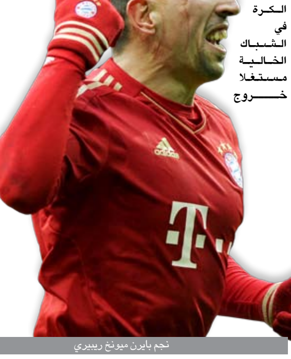
نجم بايرن ميونيخ ريبيري

■ برلين / وكالات استعاد فريق بايرن ميونيخ توازنه وتغلب على ضيفه شالكه ٢/صفر في المرحلة الثالثة والعشرين من الدوري الألماني لكرة القدم (البوندسليغا). ويدين بايرن ميونيخ بفضل كبير في الفوز لنجمه الفرنسي الدولي فرانك ريبيري الذي سجل هدفي الفريق في شباك شالكه. افتتح ريبيري التسجيل لبايرن في الدقيقة ٣٥ حيث أسكن الكرة في الشباك الخالية مستغلاً خروج