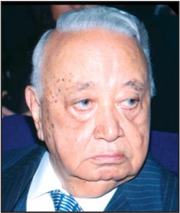
الملكية البريطانية ١٩٧٥، كما انتخب رئيساً للجنة الثقافية الاستشارية في معهد العالم العربي بباريس ١٩٩٠ - ١٩٩٣.

القاهرة - يوبي أي - غيب الموت الكاتب والمفكر والسياسي المصري الدكتور ثروت عكاشة عن عمر يناهز (٩١ عاماً). وذكر التلفزيون المصري أن عكاشة توفي بعد ظهر أمس الأول الاثنين. والراحل عكاشة المولود عام ١٩٢١، عُرف ببداية حياته المهنية كأحد أبرز أعضاء "الصف الثاني" في تنظيم الضباط الأحرار الذي قاد ثورة ٢٣ يوليو ١٩٥٢، التي أطاحت بالنظام الملكي، وحوّلت مصر إلى النظام الجمهوري. بدأ الراحل حياته السياسية والمهنية عقب تركه الخدمة في القوات المسلحة بعد نجاح ثورة ٢٣ من يوليو ١٩٥٢، ليتولى منصب رئيس تحرير