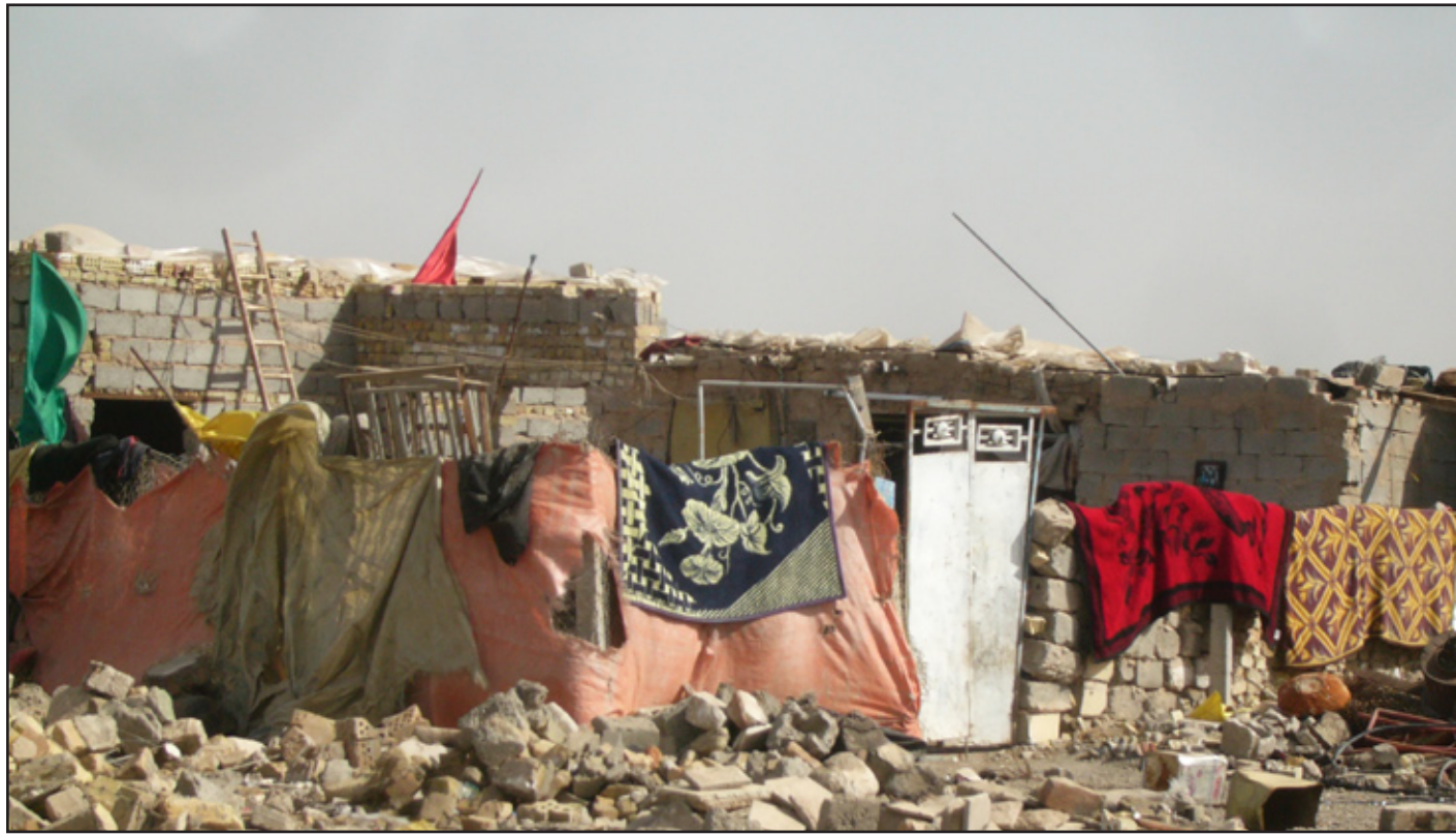
السكن في العراق في بلد النفط

بتشريع قانون للإيجار ليضربوا بنوع من الاستقرار. ومن جانبه يؤكد محافظ كربلاء أملال الدين الهر: إن نسبة النمو السكاني في كربلاء بلغت (٥٪) وتعد الأكبر في العراق وذلك يستدعي استحداث دوائر خدمية مثل المدارس والمستوصفات وغيرها.