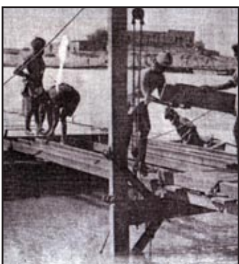
رفعة عبد الرزاق محمد

بعد أن منيت القوات البريطانية بهزيمة قاسية في الكوت عام ١٩١٦ وأسر قائدها الجنرال طاونزند، عهدت القيادة البريطانية العليا إلى الجنرال ستانلي مود لقيادة الجيش البريطاني وإكمال الخطة الموضوعة لاحتلال العراق. وقد تمكن مود من مواصلة الزحف نحو بغداد واحتلالها في مثل هذا اليوم من عام ١٩١٧، إيذانا بانتهاء العهد العثماني لهذه المدينة الذي استمر نحو أربعة قرون. انتهزت بريطانيا نشوب الحرب العالمية الأولى ودخول تركيا إليها، لتحقيق أحلامها بالسيطرة على ثروات العراق الدفينة، فقامت بحملة عسكرية كبيرة لاحتلال العراق، بدأتها باحتلال البصرة سنة ١٩١٤، واستمرت تلك الحملة لتحل العراق كله في أواخر عام ١٩١٨. لقد كان سقوط بغداد فاتحة مرحلة جديدة في تاريخ العراق، إذ