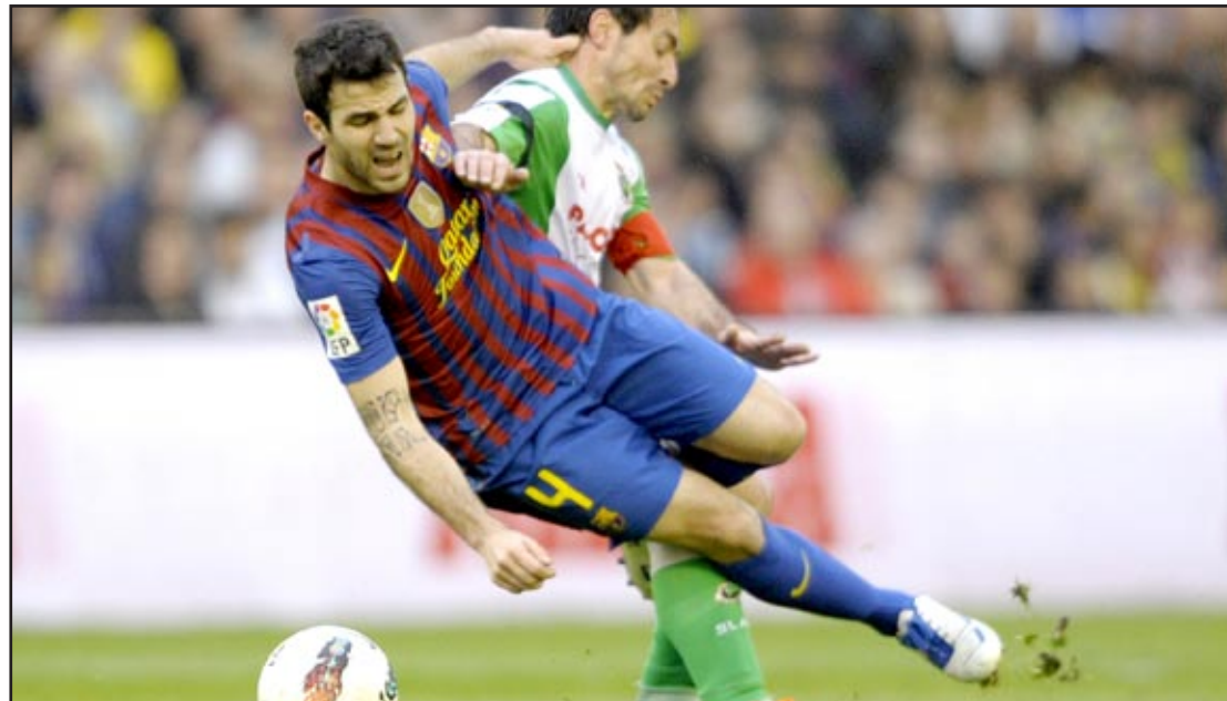
تواصل الإثارة بين برشلونة وغريمه ريال مدريد