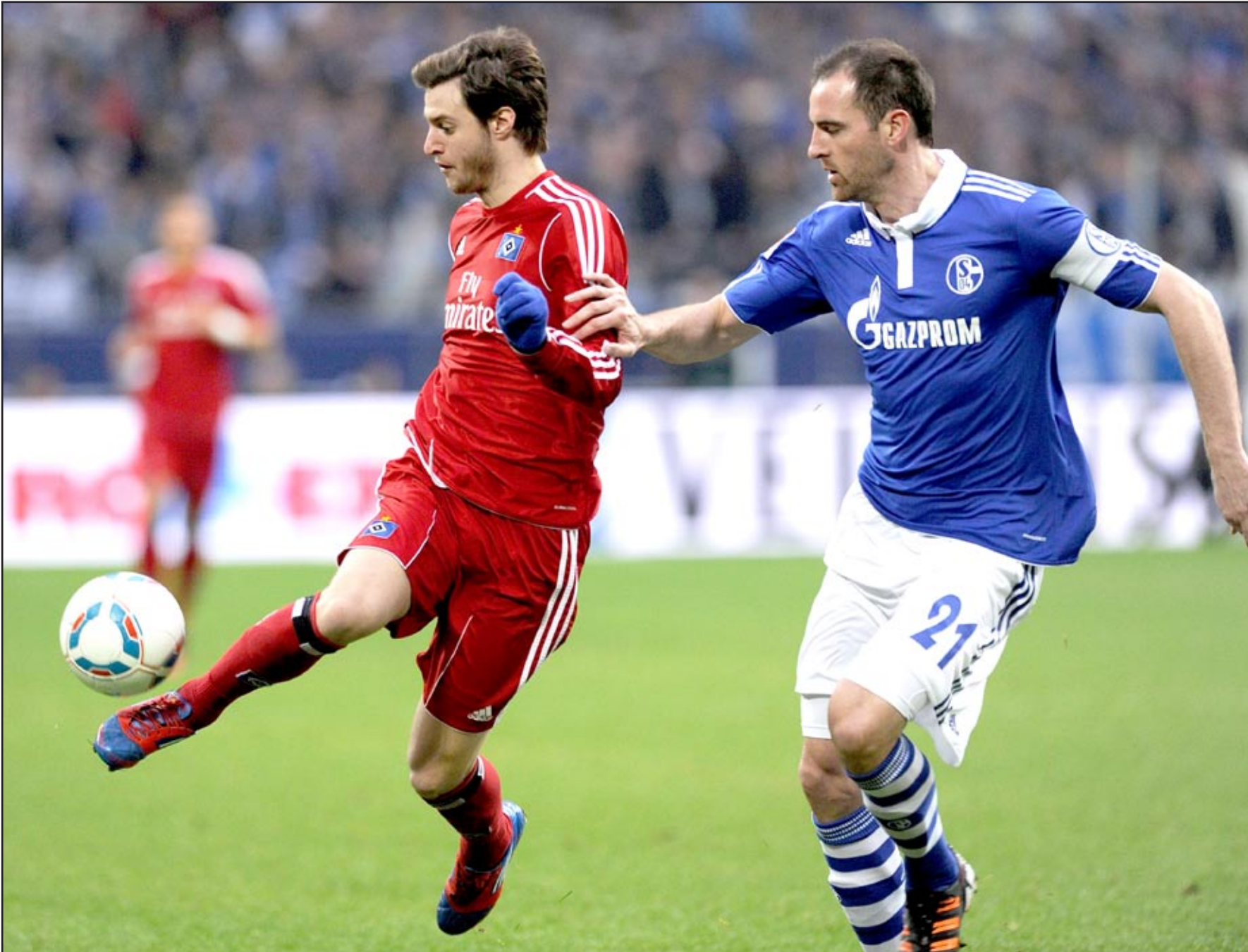
بايرن ميونيخ يتكسح هوفنهايم

يحقق بايرن ميونيخ فيه فوزا نظيفاً بهدفين مقابل لاشيء ومن دون ذلك سيخرج البافاريون من اواب هذا الدور ولن يكون لهم مكان في مراسم قرعة الدور ربع النهائي لهذه البطولة التي ستقام يوم الجمعة المقبل في مقر الاتحاد الأوروبي لكرة القدم، وفي الوقت نفسه تمكن بايرن ميونيخ، ومن خلال فوزه العريض على هوفنهايم ان يقلص فارق النقاط بينه وبين المتصدر بروسيا دورتموند الى خمس نقاط بدلا من سبع نقاط، وخاصة بعد التعادل المؤلم لنادي