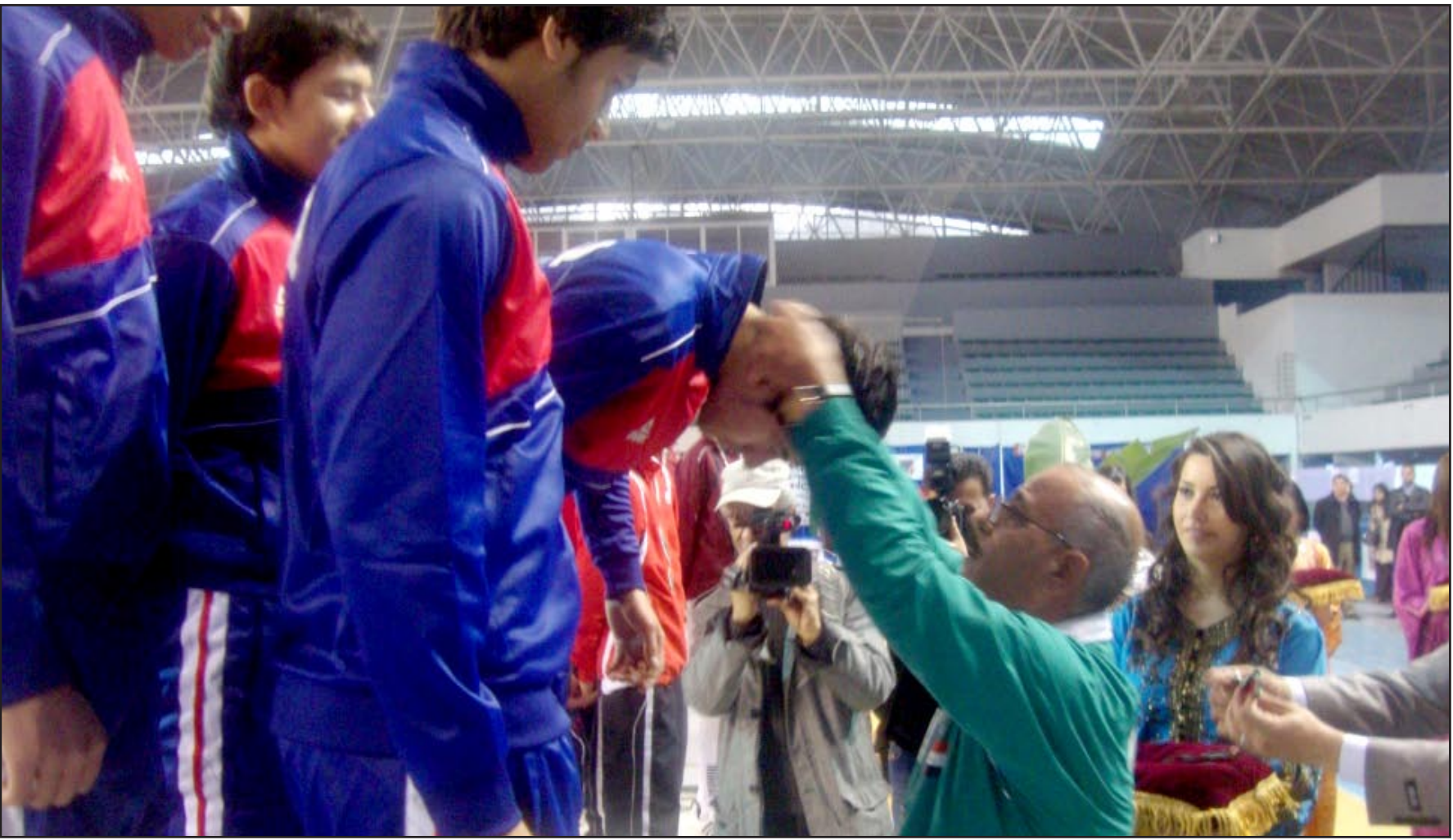
تقلد ابطالنا بالميداليات الملونة بفعالية الفرقي للاسلحة