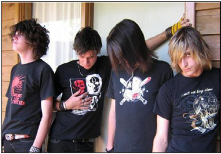
شباب الایمو..

ونفى وجود حالات قتل لشباب الایمو، وقال "لا توجد اي حالة قتل وهذا ما تم تأكيد من قبل وزارة الداخلية، اليوم اذا يقتل شاب او مراهق في العراق من الایمو ستوفر معلومات حقيقية عن مقتله، وإن الحالة التي تم اللغط فيها وتداولها حدثت في مدينة الصدر لشاب تم اختطافه وكان