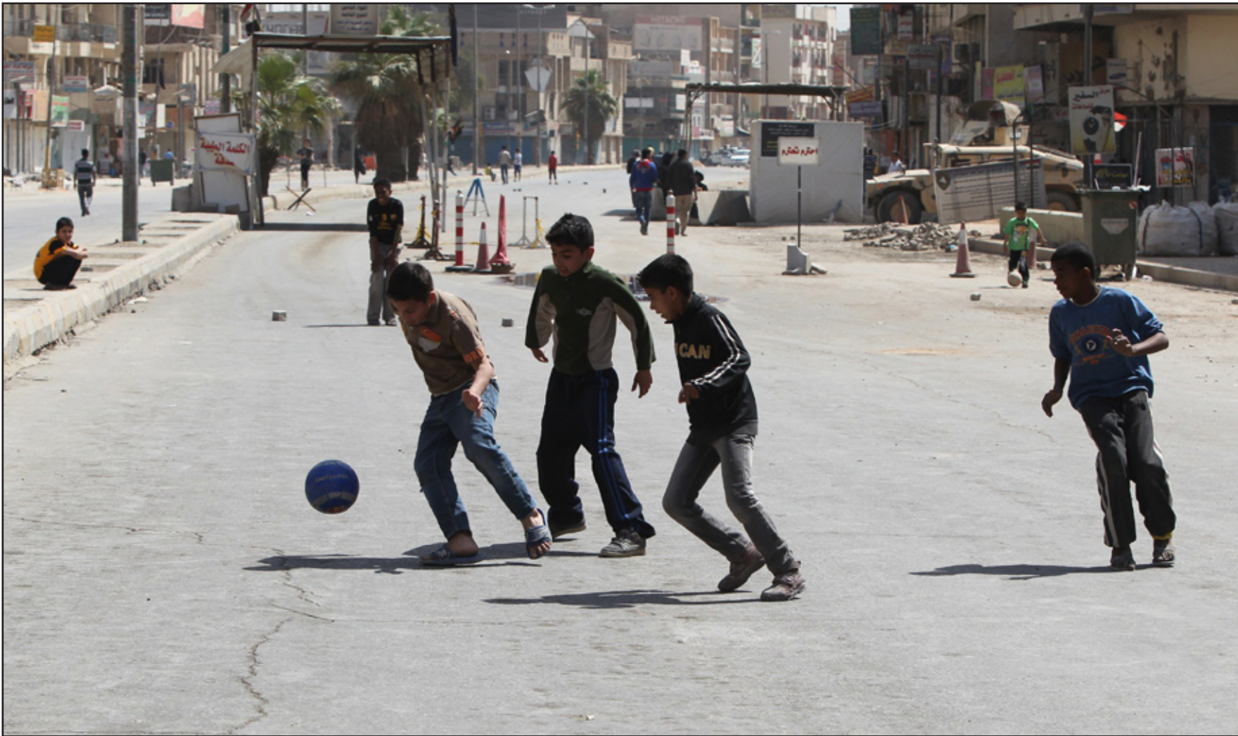
شوارع بغداد الرئيسية تحولت الى ملاعب لكرة القدم ..... أ.ف.ب

الى تدارك الوضع والجلوس معاً في وقت عاجل وذلك لوضع الأليات والإسراع في إيجاد حل لهذا الوضع ومعالجته في فترة قصيرة جداً وإلا فإننا سنلجأ الى شعبنا وأنداك سيخذ شعبنا قراره النهائي وهذا كي لاتفقوا علينا باللائمة بعد الآن .