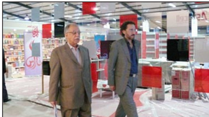
رئيس مؤسسة المدى مع الفنان نصير شمة في جولة في أروقة المعرض