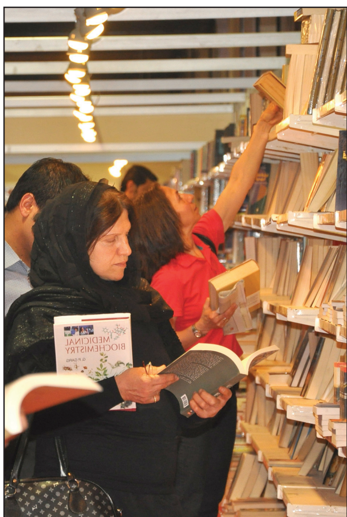
البحث عن المعرفة

رأيها قائلة: ليس جديدا علينا ما تبادر به المدى فهي سباقة في كل شيء، كل عام اجد المعرض يتميز عن السابق من حيث دور النشر المشاركة وعناوين الكتب الجديدة وقد جذبني كتاب عنوانه (نساء في