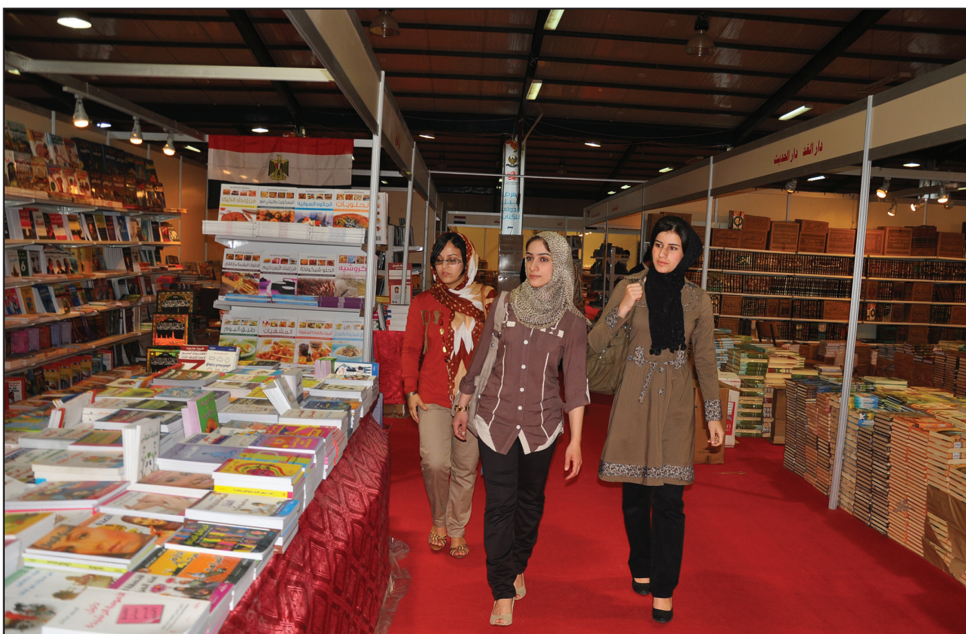
الكتب العلمية تحظى باقبال لافت

رأيها قائلة: ليس جديدا علينا ما تبادر به المدى فهي سباقة في كل شيء، كل عام اجد المعرض يتميز عن السابق من حيث دور النشر المشاركة وعناوين الكتب الجديدة وقد جذبني كتاب عنوانه (نساء في