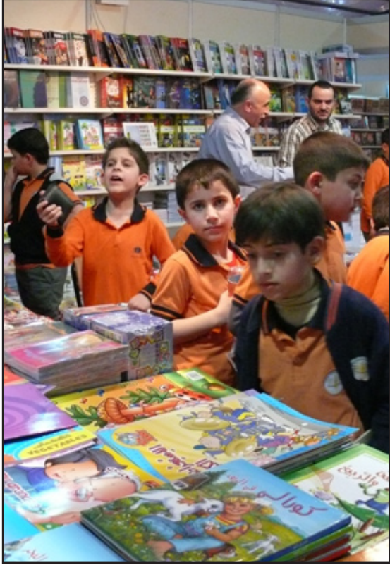
اقبال من جميع الاعمار على معرض المدى للكتاب