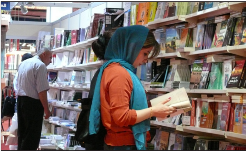
الجنس اللطيف حاضر في المعرض

بين العلم والإيمان، والأخر الوقاية من مكائد الشيطان، أتمنى النجاح لهذا المعرض.