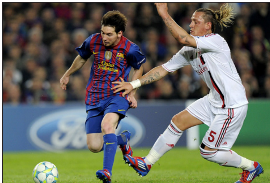
ميسي يتجاوز الهدف ٥٠ في بطولات أوروبا

ميسي، فلم يجد لوكا أنطونيني أية وسيلة لإيقافه إلا بعرقته، ليحتسب الحكم ركلة جزاء نفذها النجم الأرجنتيني بنجاح (١١) محرراً بذلك هدفه في دوري أبطال أوروبا رقم ٥٠، والثالث عشر في موسم واحد. وواصل برشلونة ضغطه بغية زيادة غلته من الأهداف، لكن الرد جاء من الجهة المقابلة على عكس سير المباراة عندما سجل ميلان هدف التعادل في الدقيقة ٢٢، إثر هجمة مرتدة وصلت إلى السويدي زلتان إبراهيموفيتش الذي مررها بطريقة ذكية إلى نوتشيريانو الذي تقدم وسدد في مرمى فيكتور فالدين.