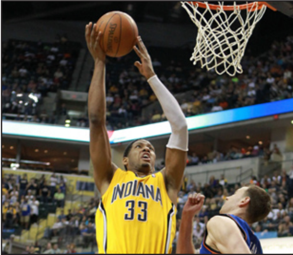
مفيس يوقف انتصارات او كلاهما

ليزيحه عن صدارة الترتيب العام. واسترد مفيس، الذي خاض مباراته الثانية على التوالي من دون صانع العالبة مايك كونلي المصاب في كاحله الأيمن، اعتباره من أو كلاهما الذي كان قد تغلب عليه في الدور نصف نهائي من "بلاي أوف" الموسم الماضي بعد مواجهة مثيرة حسمت بعد سبع مباريات، ثم تفوق عليه مجدداً في المباريات الثلاث التي جمعت الفريقين هذا الموسم قبل اللقاء الذي استهلكه صاحب الأرض بقوة بتسجيله ١٢ نقطة متتالية دون رد من ضيفه.