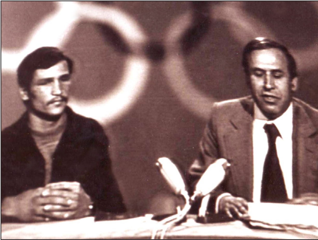
اثناء تضييف البدرى البطل فاروق جنجون عام ١٩٨٢

يشكل مدروس لإيقاف البرنامج. هل بالامكان معرفة ذلك؟ - لسترك هذا الجانب لكل حدث حديث. × ما تاريخ لآخر حلقة من البرنامج؟ - ٣١ آذار ١٩٩٣. × من المخرجون الذين تابعوا على اخراج البرنامج؟ - منهم حيدر العمر وكمال عاكف وخالد