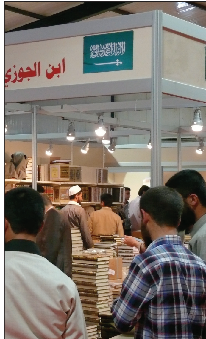
الاجنحة العربية فعالة في المعرض