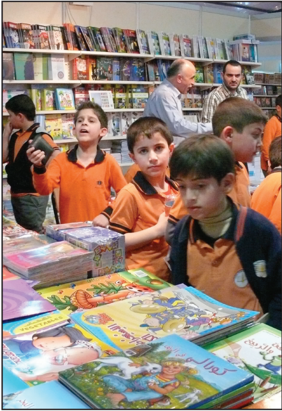
اقبال من جميع الاعمار على معرض الذي للكتاب