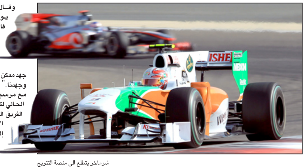
شوماخر يتطلع الى منصة التتويج

وقال شوماخر "عندما يواجه المرء صعوبات فانه يشعر حقا بمعنى الخروج منها. هذا يحتاج إلى الصبر والتركيز وتقديم أكبر جهد ممكن. الآن نجني ثمار عملنا وجهندا". وينتهي عقد شوماخر مع مرسيدس في نهاية العام الحالي لكن روس براون مدير الفريق الذي سار خلف السائق الألماني من بنيتون إلى فيراري ثم ضمه إلى مرسيدس لم يضع حدا لعلاقة الطرفين.