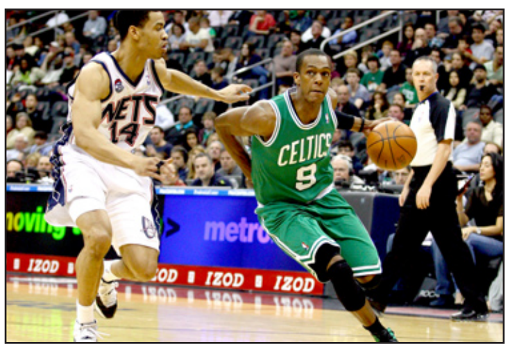
سلة بوسطن في صدارة مجموعة الاطلسي

لحق بوسطن سلتيكس متصدرا مجموعة الاطلسي بركب الفرق المتأهلة الى الدور الاول من بلاي اوف الدوري الاميركي للمحترفين في كرة السلة بفوزه على نيو جيرزي نكس ٩٤-٨٢. وسبق لفرق شيكاغو بولز وانديانا بيسرز (المجموعة الوسطى)، وميامي هيت واتلانتا هوكس (المجموعة الجنوب الشرقي)، واوكلاهوما سيتي (مجموعة الشمال الغربي)، ولوس انجليس ليكرز (مجموعة الهاديء) وسان انطونيو سبيرز (مجموعة الجنوب الغربي) ان ضمنن تأهلها الى البلاي اوف ايضا. رفع بوسطن رصيده إلى ٣٥ فوزا في ٦٠