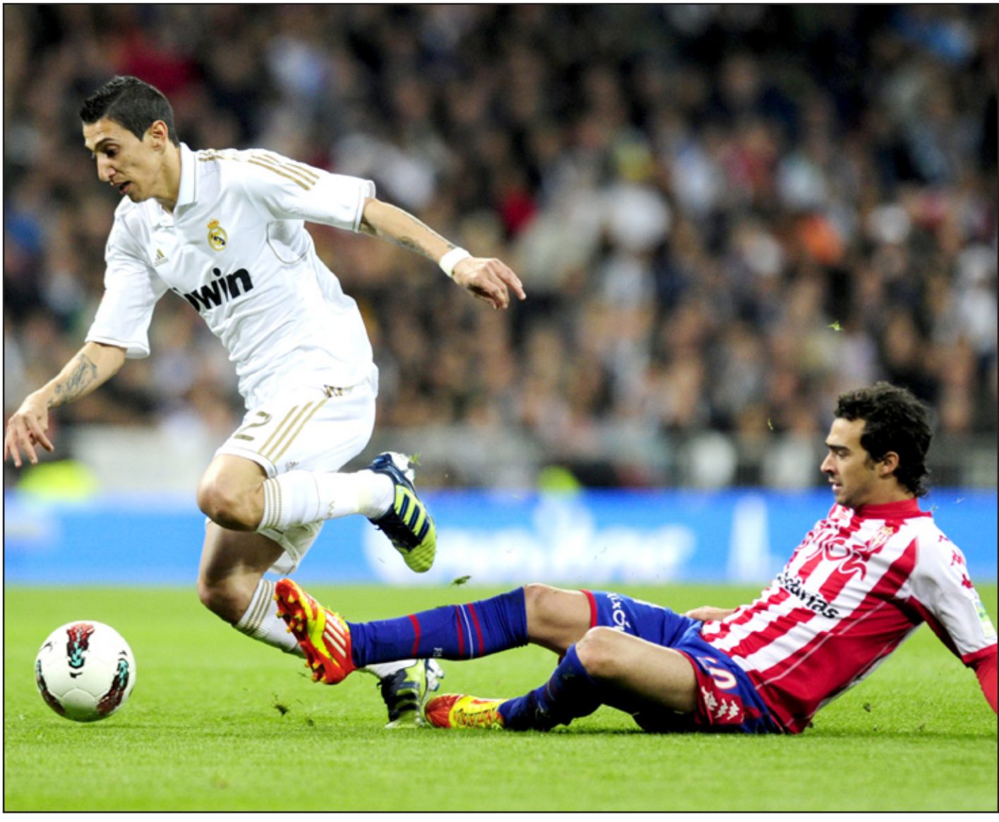
ريال مدريد يحافظ على فارق التقدم مع برشلونة

افتلت ريال مدريد من كمين سيورتيغ خيخون صاحب المركز الثامن عشر وتغلب عليه ٣-١ على ملعب "سانتياغو برنابيو" في مدريد، وبقى الأرجنتيني ليونيل ميسي الفارق على حاله بقيادة فريقه برشلونة حامل اللقب في الفوز على مضيغه ليفانتي ٢-١ في افتتاح المرحلة الرابعة والثلاثين من الدوري الإسباني لكرة القدم. رفع ريال مدريد رصيده في الصدارة إلى ٨٥ نقطة مقابل ٨١ لمطارده المباشر وغريمه التقليدي برشلونة. يبدى النادي الملكي بفوزه إلى ثلثيه الهجومي المرتب الدولين الأرجنتيني غونزالو هيجواين الذي أدرك له التعادل بعدما كان متخلفا بهدف من ركلة جزاء، والبرتغالي كريستيانو رونالدو الذي منحه التقدم للمرة الأولى في المباراة، والفرنسي كريم بنزيمة الذي طمأن انتصار النادي بالهدف الثالث. ورفع الثلاثي الرهيب رصيده إلى ٨٠ هدفا في الليغا هذا الموسم بواقع ٤١ هدفا لرونالدو متصدرا لائحة الهدافين بالتساوي مع ميسي و٢١ لهيجواين ثالث اللائحة مشاركة مع الكولومبي راداميل فالكاو غارسيا مهاجم اتلتيكو مدريد و١٨ هدفا لبنزيمة الرابع. وخاض ريال مدريد المباراة تحت ضغط كبير كونها الأخيرة له قبل مواجهته مضيغه برشلونة السبت المقبل في كلاسيكو ساخن قد يحدد ملامح البطل بشكل كبير، وبالتالي عانى الأمرين لكسب النقاط الثلاث أمام فريق تتكفل في مناطقه وسد كل المنافذ المؤدية إلى مرماه، ولم ينفعه سوى دخول بنزيمة والدولي الأرجنتيني الآخر انخل دي ماريا مطلع الشوط الثاني. وحقق النادي الملكي الأهم بفوزه وضمن سفره إلى برشلونة وفي جعبته ٤ نقاط كفارق بينه وبين النادي الكاتالوني وبالتالي سيحتفظ بالريادة حتى في حال خسارته أمام الأخير. كما