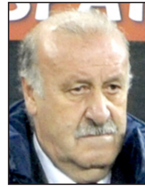
فيسنتي دل بوسكي

قال فيسنتي دل بوسكي المدير الفني للمنتخب الإسباني لكرة القدم أنه يتطلع إلى انطلاق منافسات كأس الأمم الأوروبية (يورو ٢٠١٢) التي تقام في بولندا وأوكرانيا ، وخوض الصراع من أجل الحفاظ على اللقب. وكان المنتخب الإسباني قد توج بلقب البطولة الأوروبية في نسختها الماضية التي أقيمت بالنمسا وسويسرا عام ٢٠٠٨. وقال دل بوسكي: نحن نتطلع إلى انطلاق البطولة.. أولا لأننا نريد المنافسة ، وثانيا لأننا نرغب في الحفاظ على اللقب الذي أحرزناه في النمسا عام ٢٠٠٨. يتنافس المنتخب الإسباني في دور المجموعات ضمن المجموعة الثالثة مع منتخبات إيطاليا وأيرلندا وكرواتيا.