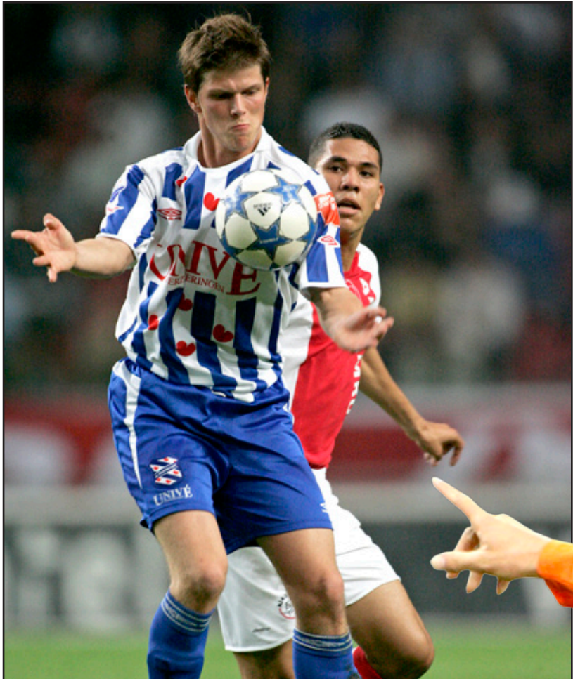
هونتلار رحلة مميزة مع شالكه

بصدر سعادة لك؟ - الأحب الى نفسي الذي يرفع من سفف سعادتي هو ان احرز اهدافا في كل اسبوع من اسابيع البوندسليغا ولا يهمني من هو النادي او المنتخب الذي اتمكن ان احرز هدفا في مرماه اعتقد ان اسم ونوع الخصم لا يهمني