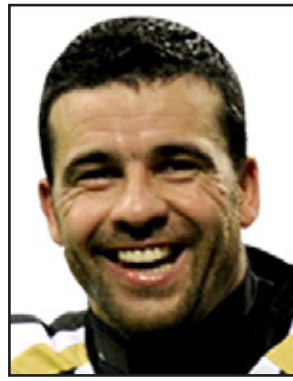
انتونيو دي ناتالي

أكد نجم أودينيزي وقائده انتونيو دي ناتالي انه يشك بمستقبله في لعبة كرة القدم بعد وفاة زميله السابق بيار ماريو موروسيني السبت الماضي خلال مباراة فريقه ليفورنو وبيسكارا في بطولة الدرجة الثانية الإيطالية. وسقط موروسيني (٢٥ عاما) على ارضية الملعب في الدقيقة ٣٣ من المباراة وحاول النهوض مجددا لكنه سقط على صدره وتلقى الاسعافات الأولية في عين المكان قبل ان تنقله سيارة اسعاف الى مستشفى سانتو سبيريتو في بيسكارا بيد ان قلبه توقف قبل الوصول. وتوقفت المباراة بعدما كانت النتيجة ٢-٠ لصالح ليفورنو، واصيب اللاعبون والإداريون والجمهور بالذهول بحسب صور التلفاز الإيطالي.