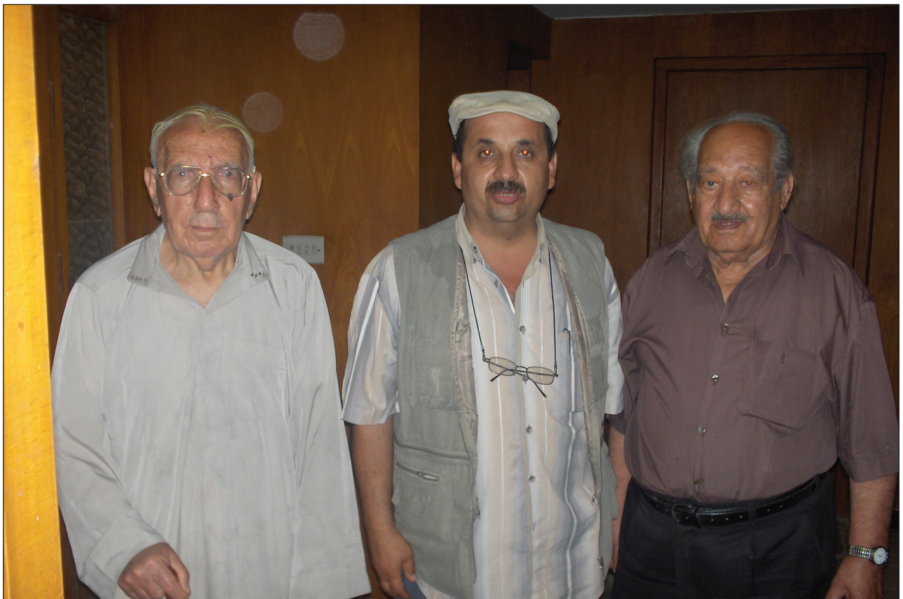
النعمان مع كاتب المقال

وفي السنوات الأخيرة رحلوا عنا الواحد بعد الآخر ، دون ان نحس بهم ونكلف أنفسنا مشقة السؤال وتسجيل كل تلك الملاحظات والانطباعات والراء التي تكونت لدى هؤلاء الأفاضل من التجربة المريرة والممارسة العسيرة لتكون الضوء