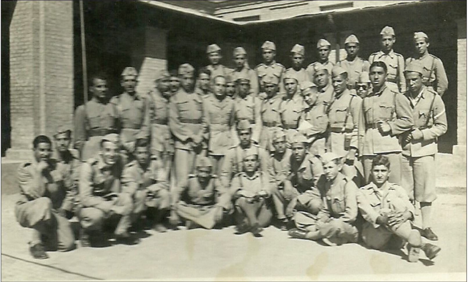
النعمان في الثانوية بملابس الفتوة