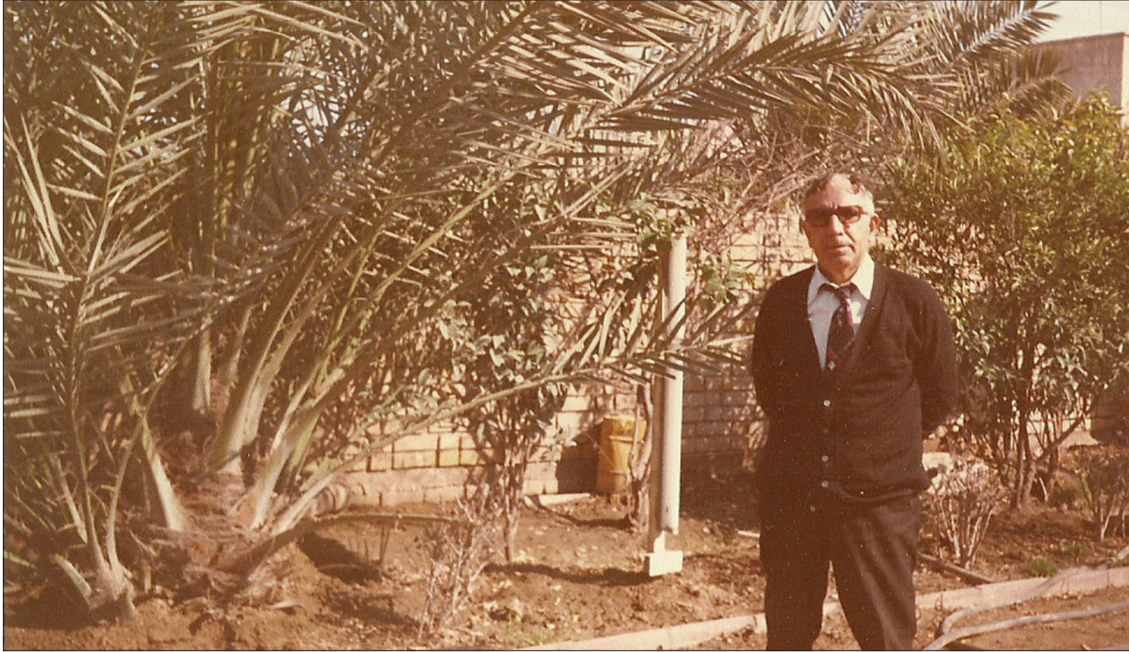
النعمان في حديقة داره

الشيوعي العراقي بقيادة فهد إعادة تأسيسه واكتمال بناءه واكتمال دوره الفاعل في الحركة الوطنية [ المطبوع عام ٢٠٠٧م من قبل مؤسسة المدى معالم ومضامين هذا الخط السياسي في الوثيقة التاريخية التي عرفت وقتها بالبيعة المشروطة .