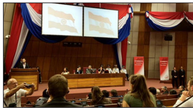
جانب من فعاليات مهرجان المنظمات الشبابية

بمشاركة كردية متميزة انعقد مؤتمر المنظمات الشبابية للاشتركية الدولية