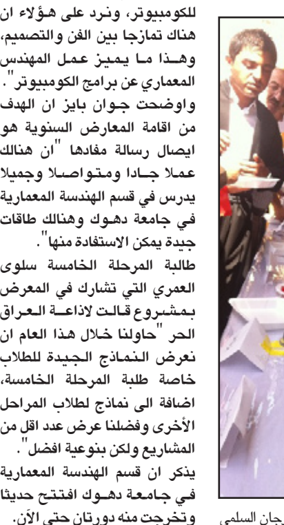
جانب من فعاليات المهرجان السلمي

اشبه بعرس جماعي وقد شاركنا بتقديم بعض الرقصات من الفلكلور الايزيدي .