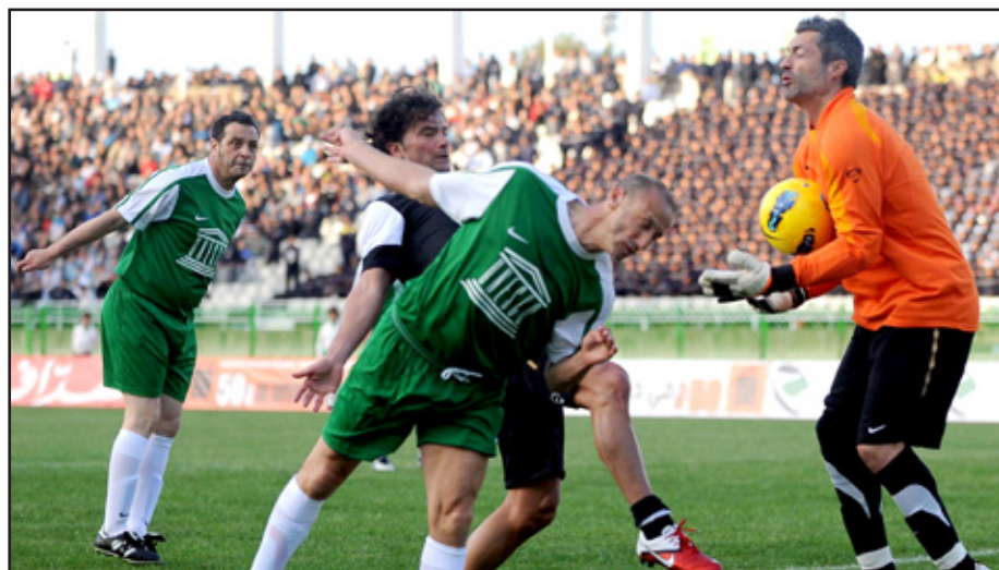
نجوم العالم تضامنوا مع أطفال أفريقيا

شهدت المباراة تألق النجم السابق لنادي بورتو والمنتخب