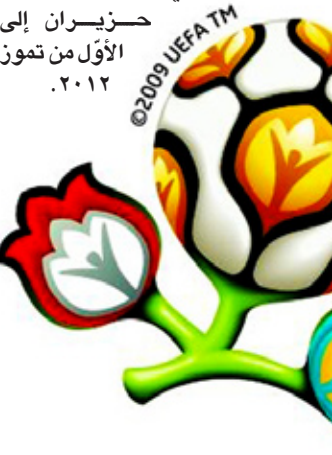
شعار يورو ٢٠١٢

وأضاف "سنبيع أيضاً ٥٠ ألف تذكرة لأن هناك اتحادات وطنية لم تستخدم حصصها بالكامل، الأسعار لن ترتفع ولن تختلف عن الأسعار الحالية". وأوضح كالن أن هناك تذاكر لا تزال متاحة لمباريات في ثلاث مدن أوكرانية هي كييف ودونيتسك وخاركيف. و في وقت سابق من هذا الشهر حذر ميشيل