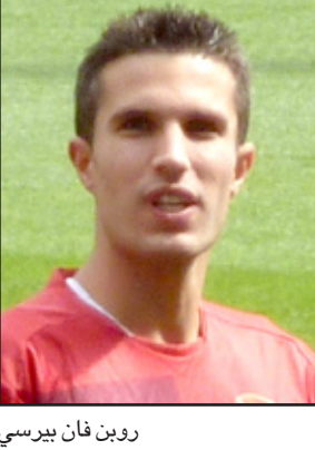
روبن فان بيرسي

■ توج المهاجم الهولندي روبن فان بيرسي جهوده مع فريقه أرسنال باختياره أفضل لاعب في الدوري الإنكليزي لهذا الموسم من قبل رابطة صحافيي كرة القدم بعد تتويجه بالجائزة عينها من قبل رابطة اللاعبين المحترفين. ويأتي اختيار فان بيرسي (٢٨ عاماً) بعد الأداء الذي قدمه هذا الموسم مع فريقه أرسنال حيث سجل حتى الآن ٢٧ هدفاً في الدوري الممتاز، ليتربع على صدارة ترتيب الهذافين أمام مهاجم مانشستر يونايتد واين روني الذي حل ثانياً في التصويت. وحل في المركز الثالث لاعب وسط يونايتد بول سكولز العائد من الاعتزال ورابعاً الأميركي كلينت ديمبسي مهاجم فولهام.