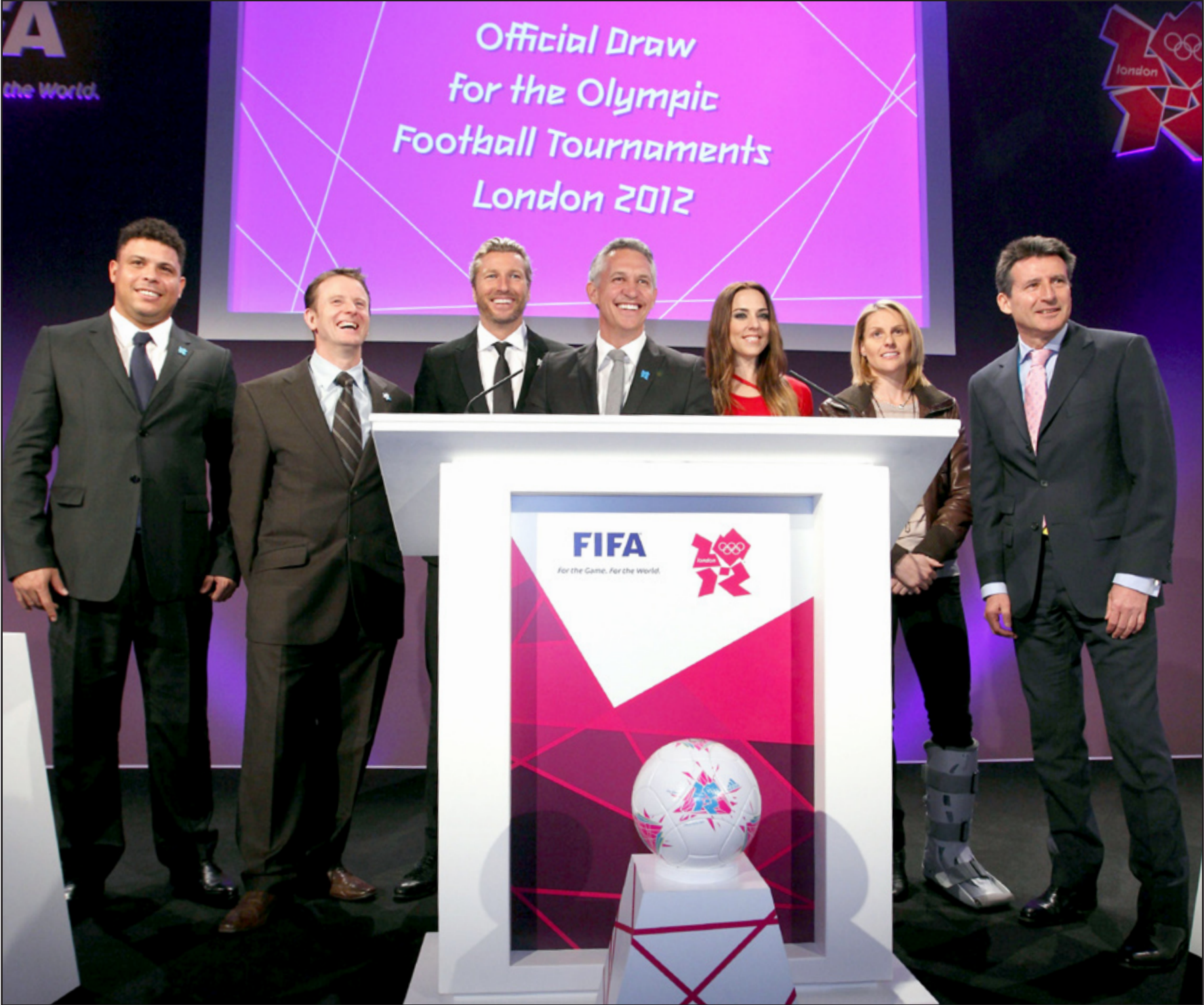
جانب من حفل قرعة مسابقة الكرة لأولمبياد لندن

سُحبت في ملعب ويمبلي قرعة مسابقة كرة القدم للرجال والسيدات ضمن دورة الألعاب الأولمبية المقررة في لندن الصيف المقبل. في مسابقة الرجال ضمت المجموعة الأولى منتخبات: بريطانيا والسنغال والإمارات العربية المتحدة والأوروغواي، والثانية منتخبات: المكسيك وكوريا الجنوبية واليابان وسويسرا، والثالثة منتخبات: البرازيل ومصر وبيلاروسيا ونيوزيلندا، والرابعة منتخبات: إسبانيا واليابان وهندوراس والمغرب. ويتأهل أول منتخبتين من كل مجموعة إلى ربع النهائي، وتقام المباراة النهائية في ١١ آب على ملعب ويمبلي. وتولى هذاف موندفال ١٩٨٦ غاري لينيكير تنسيق فقرات الحفل في صالة بوبي مور التابعة للملعب البرازيلي رونالدو والمغنية ميل سسي، كما شاركت شخصيات بارزة أخرى في القرعة على غرار الولايزي روبي سافاج والإسكتلندي كيفن غالغر، فضلاً عن المهاجمة الإنكليزية كيلي سميث. وفي المجموعة الأولى، تشارك بريطانيا لأول مرة منذ ١٩٦٠ في روما، والسنغال لأول مرة بعد إقصائها عُمان في الملحق العالمي ٢-صفر، كما تشارك الإمارات للمرة الأولى، في حين تخوض الأوروغواي المنافسات لأول مرة بعد نجاحاتها الذهبية في أولمبياد باريس ١٩٢٤ وأولمبياد أمستردام (١٩٢٨). في المجموعة الثانية، تشارك المكسيك للمرة التاسعة في الألعاب، في حين تخوض كوريا الجنوبية المنافسة للمرة السابعة على التوالي منذ ألعاب سيول ١٩٨٨ على أرضها، في حين تلعب اليابان لأول مرة وسويسرا وصيفة بطولة أوروبا تحت ٢١ سنة لأول مرة منذ نحو ٨٠ عاماً.