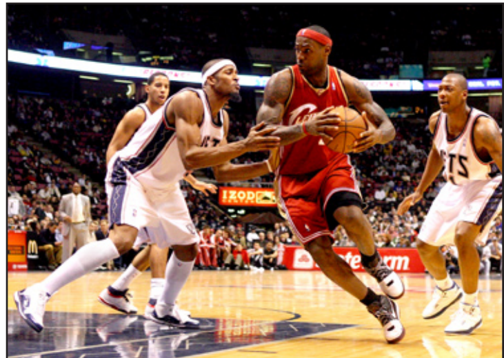
تصاعد الإثارة في السلة الأمريكية

سجل البديل كایل كورفر ٢٠ نقطة لبولز بينما ٤ ثلاثيات، وأضاف له كارلوس بوزر ١٦ نقطة والفرنسي يواكيم نواه ١٤ نقطة و١٤ متتابعة. ويات بولز بحاجة للفوز على ضيفه كيلفلاند، أو خسارة سان سان انطونيو سبيرز على أرض غولدن ستايت ووريزر ليحرز المركز الأول في ترتيب الدوري. وعدّ نواه أن تحقيق بولز المركز الأول في الترتيب العام هو أمر ثانوي "نسعى للعب كفريق ومن أجلنا نحن، كما نسعى للعب جيداً عندما تصبح الأمور أكثر جدية". ولدى بيسرز الذي كان ضمن البقاء في المركز الثالث في المنطقة الشرقية، سجل لانس ستيفنسون ٢٢ نقطة في ظل غياب داني غراينجر والبرازيلي لياندرو باربوسا.