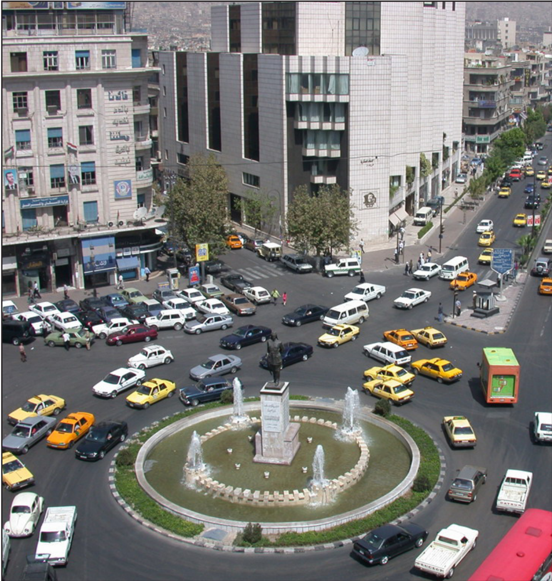
العاصمة السورية دمشق (أرشيف)

وأوضح راسموسن في تصريحاته بروكسل "أن حلف الأطلسي ليست لديه نية للتدخل عسكرياً في سوريا". وقال "أنا أدين أعمال قمع النظام السوري ضد السكان المسلمين"، داعياً السلطات في دمشق إلى "الاستجابة لآمال شعب يتناضل من أجل الحرية والديمقراطية"، وشدد على أن ذلك هو السبيل الوحيد للحل في سوريا.