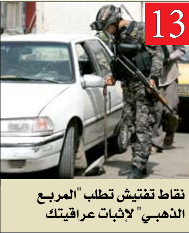
13 نقاط تفتيش تطلب "المربع الذهبي" لإثبات عراقيتك