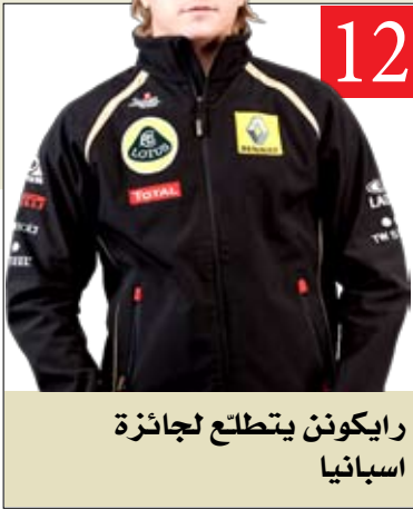
12 رايبونن يتطلع لجائزة اسيايا