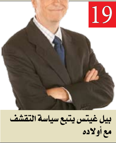
19 بيل غيبس يتبع سياسة التقشف مع أولاده

http://www.almadapaper.net Email: info@almadapaper.net