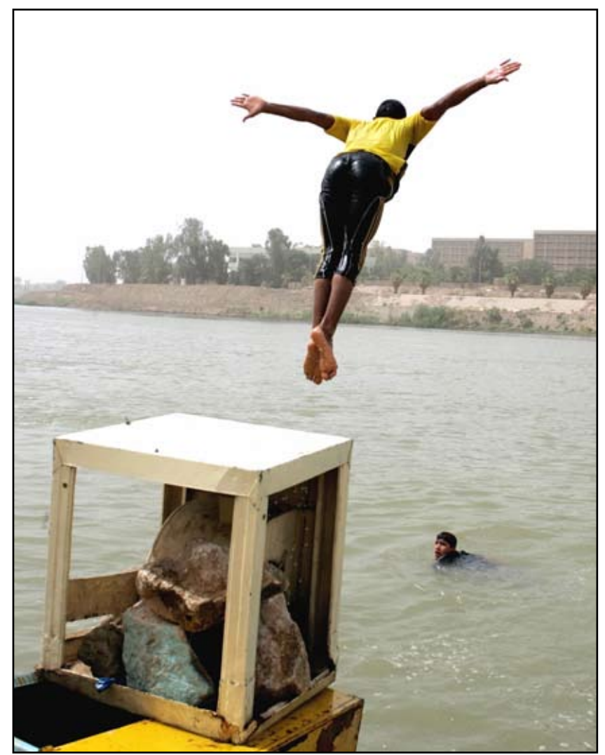
مع عودة الصيف لا يجد شبان بغداد غير دجلة ملاذاً لهم...

أعلن الناطق الرسمي باسم عمليات بغداد ضياء الوكيل أن بين ٤٥ و ٥٠٪ من شوارع العاصمة سترفع حواجزها الكونكريتية ونقاط التفتيش خلال ٤٥ يوماً، مشيراً إلى أن هناك تنظيماً جديداً لنقاط التفتيش. وقال الوكيل لـ "المدى": "إن ١١٣ طريقاً في جانب الكرخ و ٢٦ في جانب الرصافة تم فتحها، فضلاً عن رفع ٣١٠٠ كتلة كونكريتية في الكرخ و ٧٩٤ في جانب الرصافة. وأضاف أن السيطرات التي تم تقليصها بلغت ٣٨ سيطرة في الرصافة وثمانية سيطرات في جانب الكرخ، معلناً أن الشهر الجاري سيشهد فتح خمسة طرق في جانب الرصافة وإلغاء ٣٤ سيطرة ومرابطة في عموم بغداد، تنفيذاً لأمر القائد العام للقوات المسلحة في بيان أعلنت فيه قيادة بغداد سابقاً تقليص نقاط التفتيش في كل شوارع العاصمة، مؤكداً أن رفع الحواجز من الشوارع مستمر باستثناء المنشآت الحيوية.