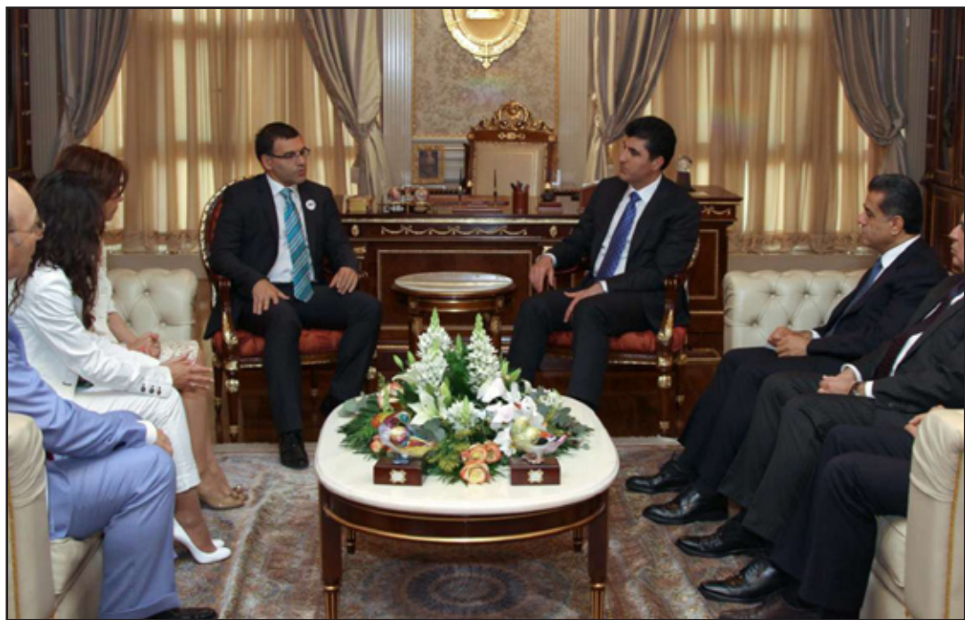
نيجيرفان بارزاني يلتقي عدداً من القضاة

وأضاف رئيس حكومة إقليم كردستان نيجيرفان بارزاني أن "سيادة واستقلال القانون والحد من التدخل في شؤون القضاء من