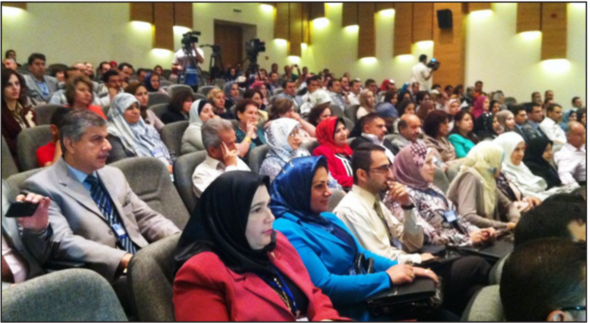
جانبا من فعاليات مؤتمر العلوم البيولوجية

وفي كلمته ركز رئيس جامعة دهوك الدكتور لقمان على الجهود الحثيثة التي بذلتها الجامعة من اجل تنظيم هذا المؤتمر وقال " لقد حرصنا ان تكون المشاركة كبيرة وعلى مستوى عال ومن جامعات عالمية وعراقية وذلك كي يخرج المؤتمر في النهاية محققا الأهداف التي حددت له، وقد حاولنا ان ننجز هذا المؤتمر خصوصية بحث شاركت فيه بحوث من جامعات عالمية من بريطانيا وفرنسا وماليزيا ودول اخرى وتم اختيار البحوث