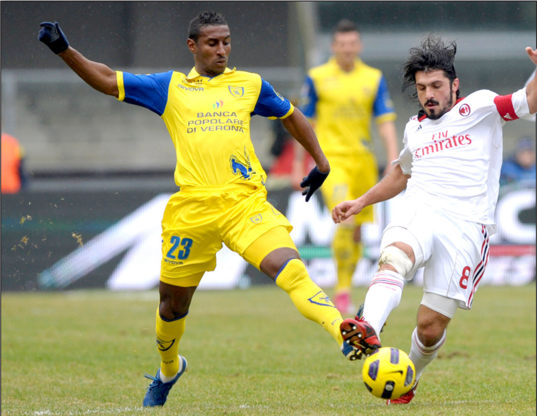
غاتوزو يغادر صفوف ميلان

وأكد مدير عام فريق روما الإيطالي فرانكو بالديني رحيل المدرب الإسباني لويس إنريكي عن فريق العاصمة بعد أن أخفق في تطبيق الأسلوب الهجومي على طريقة برشلونة. وقال بالديني لشبكة سكاي سبورتس: أراد لويس إنريكي أن يعلن رحيله عن الفريق في بادئ الأمر، لكن العمل