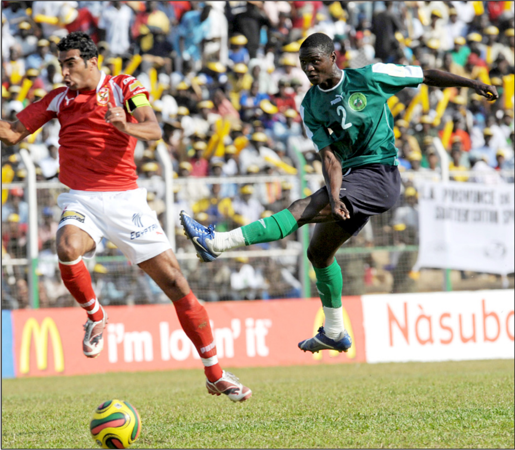
الأهلي يصطدم بالملعب المالي