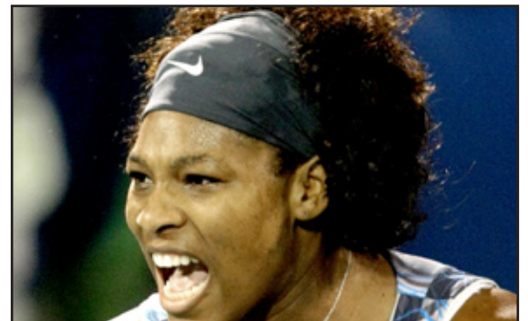
سيرينا تؤكد تفوقها