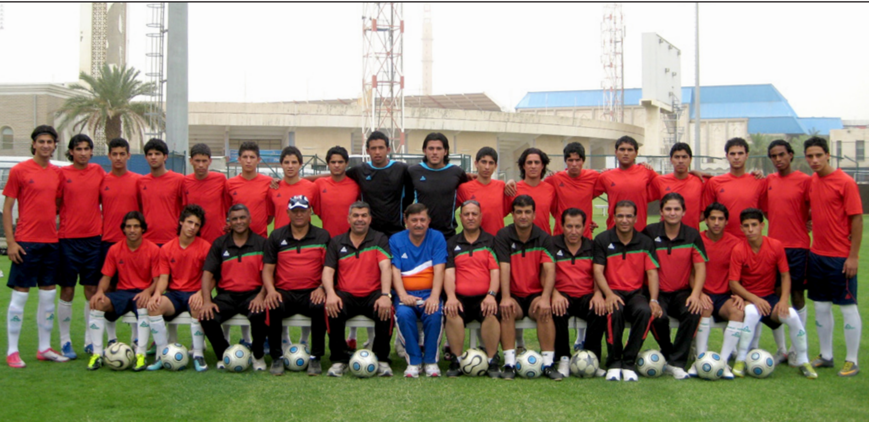
منتخب الشباب يتربح حظوظه في القرعة الآسيوية

من خلال مشاركته في تصفيات المنتخبات الأولمبية تحت ٢٢ عاما التي تضيفها سلطنة عُمان خلال الفترة