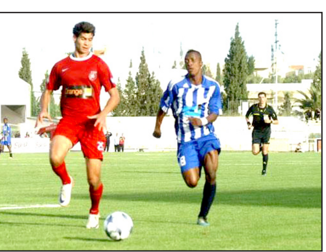
الإفريقي يواصل نجاحه في كأس الإفريقية