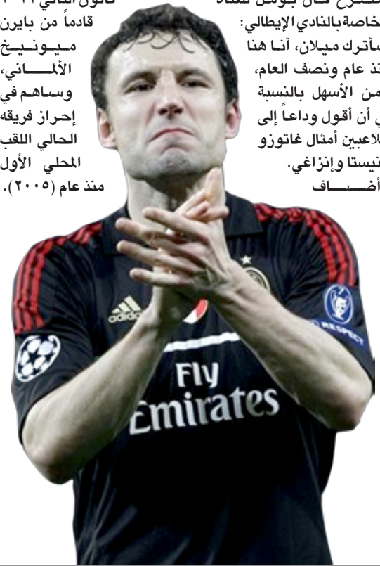
مارك فان بومل

صاحب 35 عاماً: إنّها الحياة، لقد جاءت اللحظة المناسبة للرحيل، عندما أتيت، الجميع قال لي إن النادي يضمّ عائلة واحدة، وهذا صحيح وهذه الحقيقة. انضم فان بومل إلى ميلان في فترة الانتقالات الشتوية في كانون الثاني 2011 قادماً من بايرن ميونيخ، الألماني، وساهم في إحراز فريقه الحالي اللقب المحلي الأول منذ عام (2005).