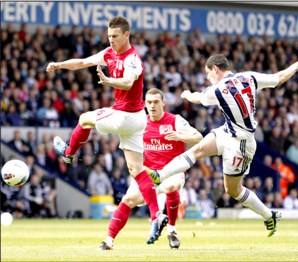
الأرسنال ثالث الدوري الإنكليزي في إحدى مبارياته

بامتياز في أرسنال، فقد نال جائزة أفضل لاعب في الدوري، متفوقاً على نجوم قطبي مدينة مانشستر صاحب المركزين الأولين ومحرزاً لقب هداف الدوري برصيد 30 هدفاً إلى جانب صناعة 12 هدفاً آخر، أي أنه كان سبباً في 43 هدفاً من أصل