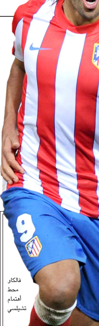
فالكاو محط اهتمام تشيلسي

في 2010، 22 نقطة مع 10 متابعات وه تمريرات حاسمة، وأضاف دواين وايد 29 نقطة مع 4 تمريرات حاسمة. وتعرض كريس بوش إلى إصابة في عضلات البطن بعد 16 دقيقة سجل خلالها 13 نقطة مع 5 متابعات. وفي صفوف الخاسر، برز الثاني روي هيبيرت وديفيد ويبست بتسجيل كل منهما 17 نقطة.