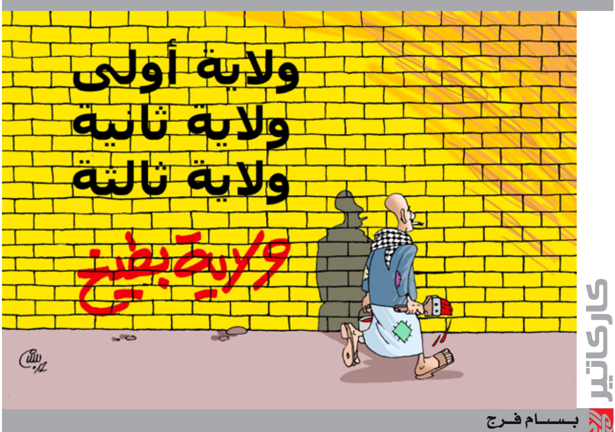
كاركاتير بسام فرج

ساسة ومسؤولون بلا مقدرة ولا كفاءة ولا خيال، لإخيل القتل والسرقة وإثارة الفتن والمحن. أعرف وكما يعرف ملايين العراقيين أن المصيبة فاحشة، وأن ما جرى بحق هذه البلاد فوق الاحتمال، اليوم نتساءل هل نصدق المالكي أم نصدق صولات المالك؟ سنكتشف ولو متأخرا إن ما جرى هو طبخات للاستخدام وملء فراغ ادغمة الناس الحائرة؟ ولعلنا نتساءل ما الدور الجديد الذي سيقوم به المالك؟ وما هو حجم الأموال التي ستسرق من ميزانية الدولة لتمنع للملك وغيره من أجل أن يناصروا المالكي في معاركه الجديدة..، والأهم هل سنستيقظ يوما لنرى صورة المالك وهو يوزع الإبتسامات وتحته عنوان عريض يقول انتخبوا مرشح دولة القانون المناضل صالح المالك فهو خير من يمتلككم؟!