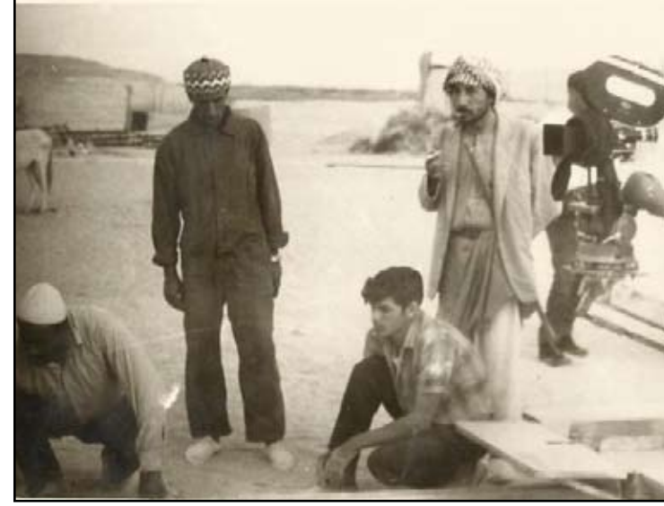
في موقع التصوير

- لا .. لا أبداً أنا أكره التزجسية .. وأكره من يجب ذاته أكثر من حب الناس ..أنا غادرت بعد أن قفلوا عني الهواء النقي ، لا أستطيع أن أتفلس في جو ملوئ غارات سامة ، شعرت بأن هناك من يحاول قطع أنفاس أهل الفن والثقافة والأدب ، أنا رجل لي مبادئ وانتميتي إلى المشاكسين