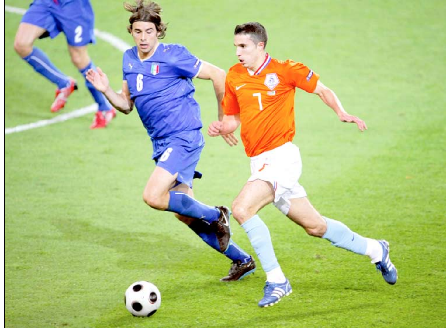
بيرسي ينتظر فرصة إثبات ذاته في يورو ٢٠١٢

سيكون مهاجم أرسنال الإنكليزي روبن فان بيرسي أمام فرصة الخروج من ظل زميله في المنتخب الهولندي ويسلي سنايدر وآرين روين عندما يخوض (البرتغالي) نهائيات كأس أوروبا ٢٠١٢ المقررة في كل من بولندا وأوكرانيا . ويدخل فان بيرسي إلى البطولة القارية بمعنويات مرتفعة جداً بعد الموسم الاستثنائي الذي قدمه مع أرسنال حيث توج بلقب هداف الدوري الإنكليزي (٣٠ هدفاً في ٣٨ مباراة) ما ساهم في احرازه جائزة أفضل لاعب في الدوري الممتاز . وفرض فان بيرسي نفسه من أبرز نجوم القارة العجوز خلال الموسم المنصرم واضعاً خلفه الإصابات المتكررة التي حرمتها من المشاركة في أكثر من ٢٥ مباراة خلال موسم ٢٠١٠-٢٠١١ من الدوري الإنكليزي . وهو يضع الآن نصب عينيه أن يتقلد نفسه النجم المطلق لمنتخب بلاده بعد أن اكتفى بتسجيل هدف واحد خلال مونديال جنوب أفريقيا ٢٠١٠ الذي وصل فيه الهولنديون إلى النهائي قبل أن يخسروا أمام الاسبان (صفر-١ بعد التمديد) . وستكون نهائيات بولندا وأوكرانيا ٢٠١٢ البطولة الكبرى الرابعة لفان بيرسي مع المنتخب الوطني بعد أن كان ضمن التشكيلة التي خاضت أيضاً نهائيات مونديال ٢٠٠٦ وكأس أوروبا ٢٠٠٨ ، لكنه يسعى هذه المرة أن يستفيد من النضوج الذي وصل إليه ، لكي يكون عنصراً مؤثراً جداً في المنتخب الذي سيعتمد بقيادة المدرب بيرت فان مارفيك على مهاجم وحيد في المقدمة ما سيدخل نجم أرسنال في منافسة مع هداف الدوري الألماني يان كلاس هوتنبار الذي تفوق عليه في التصفيات من خلال تسجيله ١٢ هدفاً ، مقابل ٦ لاول .