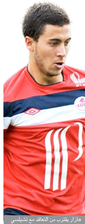
هازار يقرب من التعاقد مع تشيلسي

ان يترك مكانه لهوتنبار . ويأمل فان بيرسي ان لا يختبر ما حصل معه في مونديال جنوب أفريقيا حيث تسبب الاحتياط الذي شعر به جراء فشله امام المرعى ، بالدخول في مشادة مع مدربه بعد ان قرر الاخير اخراجه من الملعب في مواجهة الدور الثاني امام سلوفاكيا . ولم يقدم فان بيرسي شيئاً يذكر في نهائيات جنوب أفريقيا مقابل تألق سنايدر وروبن ، لكنه تأثر حينها بشكل كبير بالموسم (الاسود) الذي امضاه في الدوري الإنكليزي حيث تعرض لاصابة في كاحله ابعده عن الملاعب من تشرين الثاني الى نيسان . ويسعى مهاجم ارسنال الذي سجل هدفاً وحيداً كان في مرعى الكاميرون (٢-١) خلال الجولة الاخيرة من الدور الاول امام الدنمارك والمانيا والبرتغال ، ما سيجنحه فرصة فرض نفسه والاسيطر الى