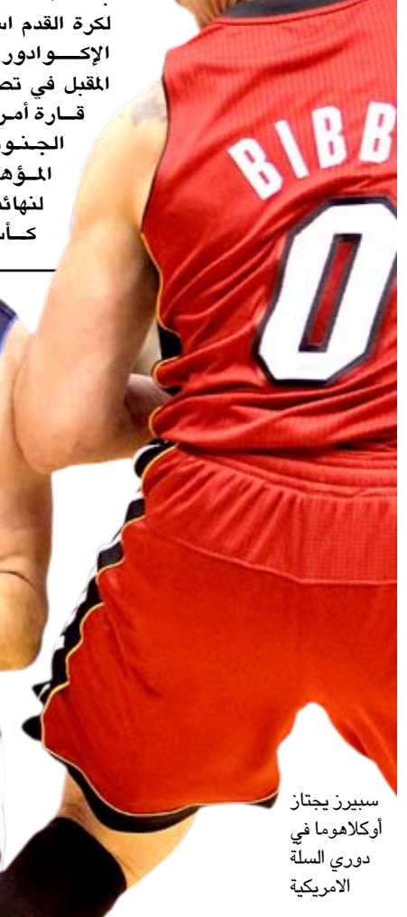
سبيرز يجاز أوكلاهوما في دوري السلة الأمريكية

العالم ٢٠١٤ بالبرازيل ، من دون قائدته ولمهغه ليونيل ميسي نجم برشلونة الاسباني . ووصل ميسي من برشلونة إلى قريته روساريو ، وانضم اللاعب إلى الساعب إلى التدريبات منذ يوم امس الإكوادور .