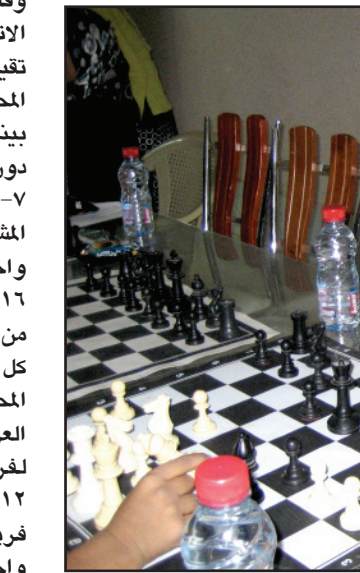
من بطولة السليمانية للفئات العمرية بالشطرنج

نادي الرسيل للشطرنج وبالتعاون معه، على ان تقام بطولات فئات : 6، 8، 10، 12، 14، 16، 18، 20 في وقت