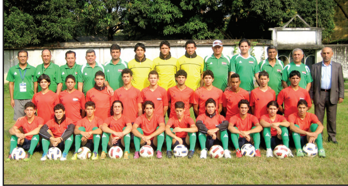
منتخب الشباب تحت سن 22 عاما

والعادلة ومسيرتها الرياضية الواعدة. و اضاف : ان نقدم لكم بعظيم الشكر والتقدير لمواقفكم النبيلة والدائمة نبارك لكم على ما تميزت به بعنتمكم وافرادها كافة على جميع الصعد وعلى فوزها بالمركز الثالث في البطولة والفريق المثالي شاكرين الله على سلامة العودة الى الديار وأملين اللقاء الشيق بمنتخب أسود الرافدين العراقي العام القادم على ارض فلسطين والقدس الشريف وقد تحتررت من ظلم وفضام الاحتمال.