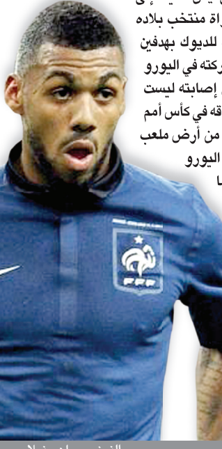
الفرنسي يان مفيدا

تعرض لاعب الوسط الفرنسي يان مفيدا إلى إصابة في كاحل الساق في مباراة منتخب بلاده الودية أمام صربيا التي انتهت للديوك بهدفين دون رد وظن اللاعب أن حلم مشاركته في اليورو قد تلاشى لكن الأطباء أكدوا أن إصابته ليست خطيرة وبإمكانه أن يكون مع رفاقه في كأس أمم أوروبا لكرة القدم. وخرج مفيدا من أرض ملعب ريمس بالمناسبة واعتقد وأن اليورو انتهى بالنسبة إليه قائلا: عندما كنت بصدد الخروج من الملعب تخيلت الكثير من الأمور، مثل أنني لن أشارك مع المنتخب في اليورو لتعرضي للإصابة نفسها عندما كنت في سن ١٣ وبقيت شهرين حتى شفيت من هذه الإصابة، لقد كنت متوترا كثيرا.