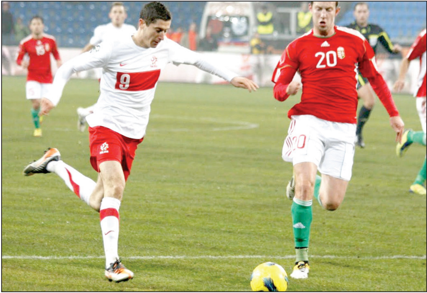
بولندا تعول على قدرات لاعبيها الشباب

اما بالنسبة للمنتخبات الأخرى، فهناك الإيطالي بورييني (٢١