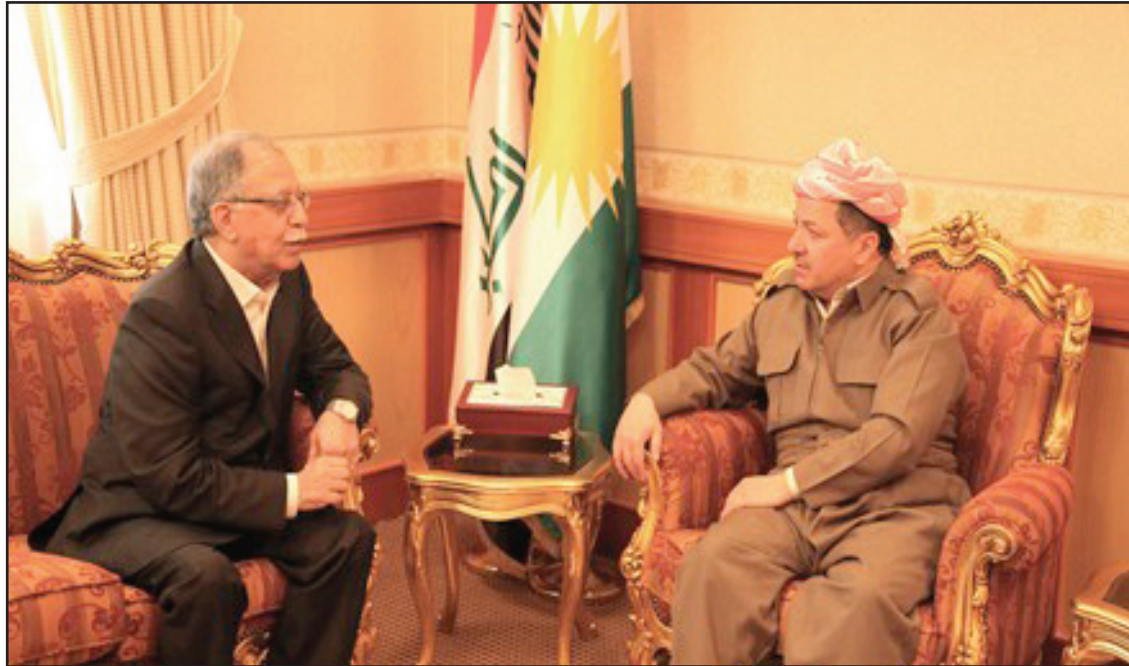
بارزاني يستقبل رئيس مؤسسة المدى

وحسب الوكالة فإن "الطرفين سيبخنان خلال اللقاء الذي من المفترض أن يتم في مقر حزب العدالة والتنمية، خارطة الطريق المعدة من قبل حزب الشعب