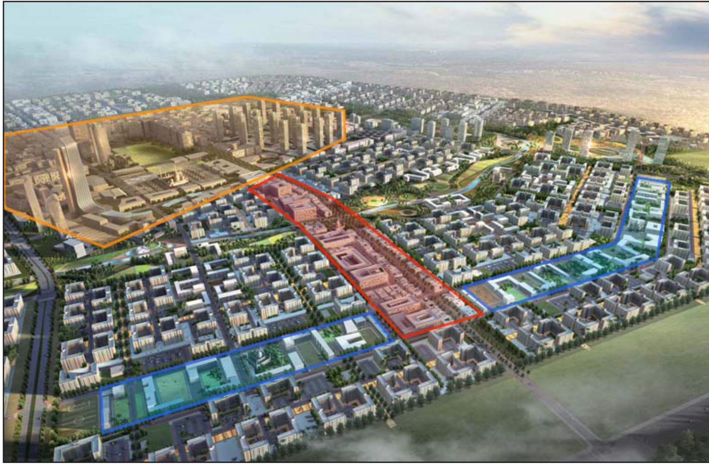
صورة حاسوبية لمشروع بسماية السكني

السومرية نيوز) : إن الأمانة خصصت قطعتي ارض لوزارة الإسكان والإعمار الأولى في جانب الرصافة بمساحة ٧٠ دونما والأخرى في جانب الكرخ بمساحة ٢٠٠ دونم لبناء مجمعات سكنية للمواطنين خلال العام الحالي .