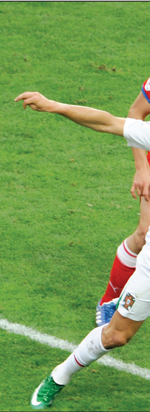
رونالدو في صفة صعبة امام المشاهات