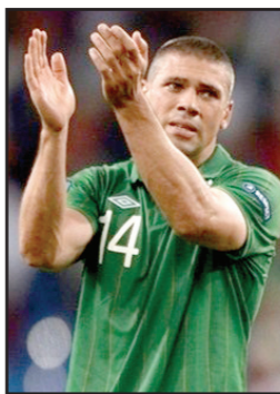
شين سان ليجر

نافاس عن قرار مدربه فيسنتي ديل بولغا من إخراج رأس حربة في بوسكي بعدم الدفع على حربة في مباراة إيطاليا التي انتهت بالتعادل ٢٠١٠ مباراة حاصل اللقب وبطل العالم ١-٠، مبررا بأن رأس زملاءه نجحوا في تهديد دمرى الأزوري برغم عدم وجود مهاجم.