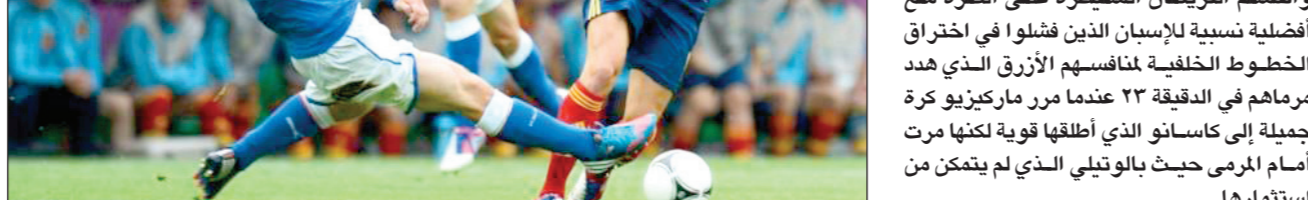
بلل النسخة السابقة بحقق في اجتياز إيطاليا

ووقع بواتينغ في الدقيقة ٥٧ سريعا ثم إهداره هدفا في المباراة لا ينعف فيها التدم، فأخرجه برانديلي ووقع مكانه بياطونيو دي ناثالي الذي أثلث صدور الإيطاليين لدى دخوله بافتتاحه التسجيل في الدقيقة ٦٦ إثر تمريرة