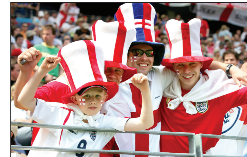
يورو يتسلل الإنكليز عن التزامتهم

بينما أوضحت الشرطة أنها تجري تحقيقا في الواقعة.