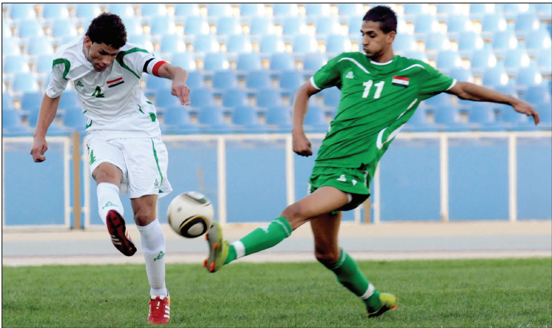
واحدة من مباريات الأولمبي السابقة