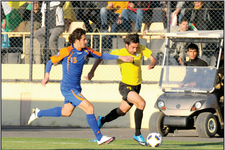
فوز ثمين لكركوك