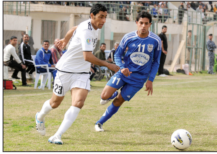
تجدد جديد للزوراء

الفريقين مرشحة لترتقي الى مستوى من الإنارة والندية والصراع الساخن بين الطرفين من اجل الظفر بنقاط المباراة كاملة. وللتذكير بموقف الطرفين نجد ان بغداد يشغل المركز السابع برصيد ٤٤ نقطة متقدما