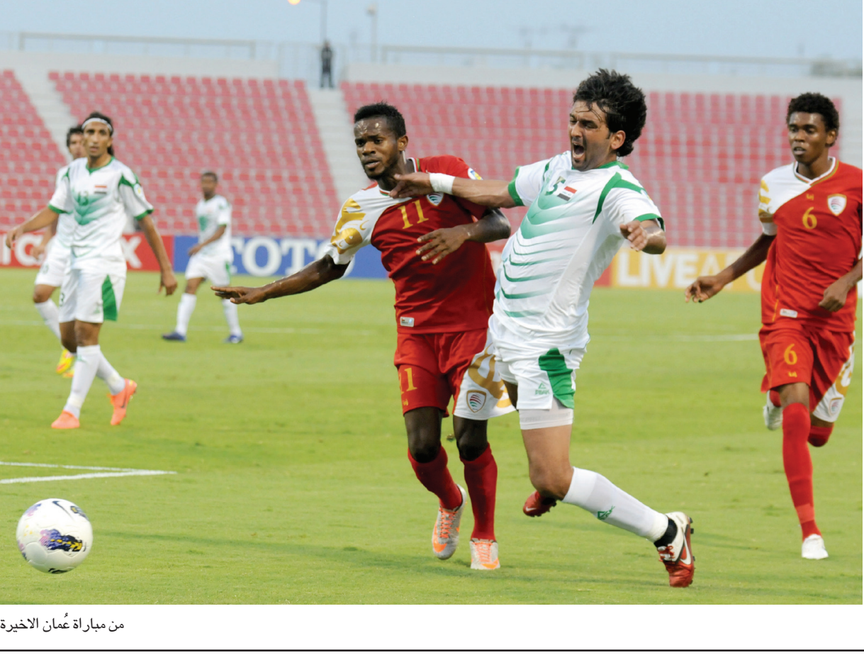
من مباراة عُمان الاخيرة