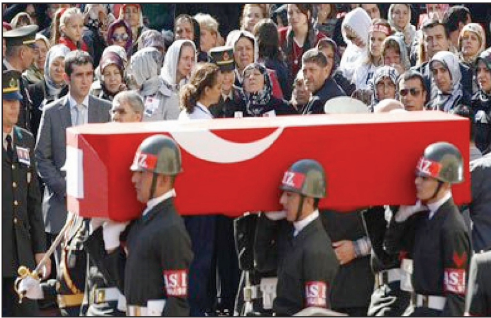
تشجيع الجنود القتلى في انقرة

وفي سياق متصل جددت الطائرات والمدفعية التركية، مساء الثلاثاء، قصفها المناطق الحدودية في إقليم كردستان، وقال مصدر مطلع من ناحية ديرلوك التابعة لقضاء أميدي في محافظة أربيل لـ PUKmedia: بأن المدفعية التركية قصفت بكتافة قرى (زلي)، كيزيكي، برجى، راشافا، وبشتا سوري سكري)، في الساعة