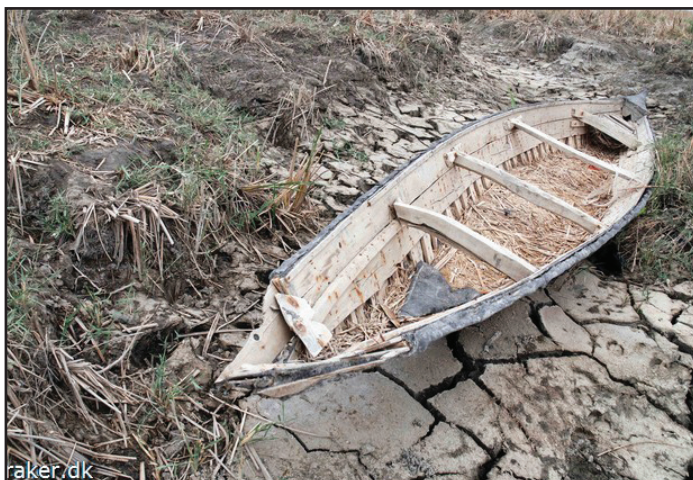
أهوار ميسان تعاني الامهال والجفاف... (أرشيف)