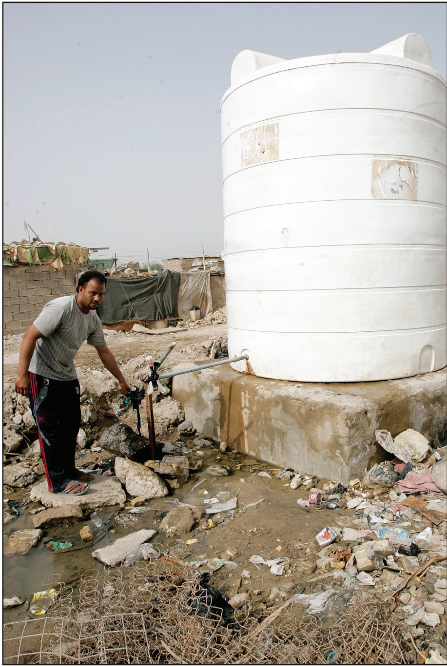
انقطاع الماء المستمر في معظم مناطق العاصمة..

في مجلس النواب، والمجلس الأعلى لمكافحة الفساد نسخا من محضر التحقيق. وأضاف الجبوري أن لجان مكتب المفتش العام اكتشفت أثناء قيامها بعملها الاعتيادي في إحدى الكليات الأهلية حالة تزوير وغش في الامتحانات، مشيرا إلى أن المكتب شكل لجنة للتحقيق في القضية وجمع الأدلة والمستندات التي تثبت قيام شخصين بإداء الامتحان بدلا عن نائين في مجلس النواب وتثبيتها في المحضر الذي كتب من قبل محققين وخبراء في كشف التزوير. وتابع الجبوري أن مكتب المفتش العام ليس له صلاحية التحقيق مع أعضاء مجلس النواب الذي ستقوم به هيئة النزاهة، مبينا أن المكتب وجه جميع الجامعات الحكومية والأهلية بتزويدها بأسماء الطلبة من الدرجات الخاصة للتحقيق في ملفاتهم ووثائقهم.