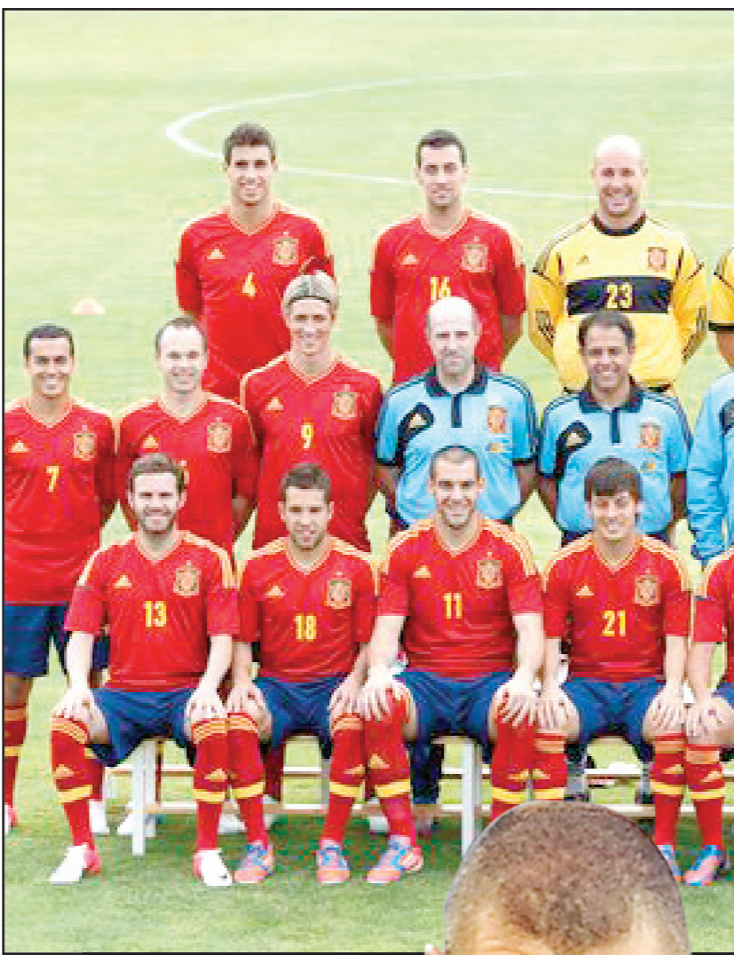
حامل اللقب المنتخب الإسباني يتأهب لاجرة فرنسا اليوم

■ نحن نحترم المنتخب الفرنسي وهو منتخب من زال مرشحا قويا للثهاب في البطولة حتى النهاية، واعتقد ان اي تحالط او اي اهمال في هذه المباريات بالرغم من خسارته الاخيرة وسولا الى المباراة النهائية والفوز باللقب،