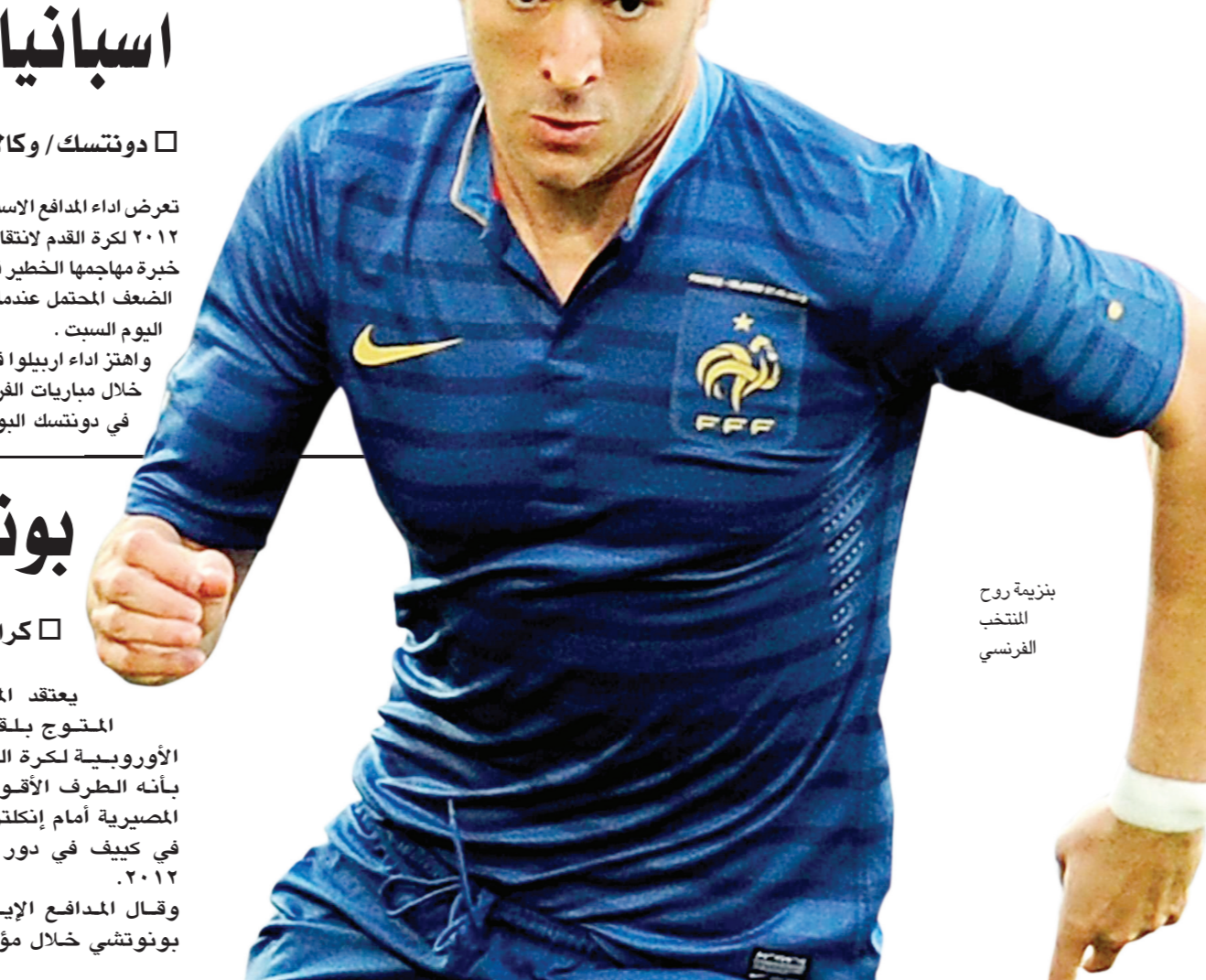
بنزيمة زوج الفرنسي

وقال بوجوسيان الفائز بكأس العالم مع فرنسا عام ١٩٩٨ في فرنسا نجحت في استعادة التنازع بين صفوفنا مع لا