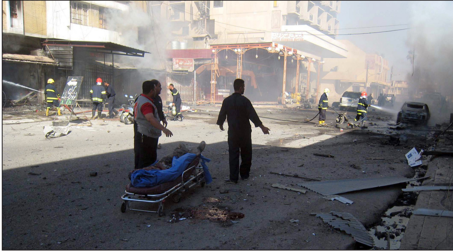
من تجبيرات الأربعا الماضي في كركوك (ارشيف)

الحادث، ونقلت القتلى إلى الطب العدلي، فيما نفذت قوة أمنية أخرى عملية دهم وتفيتش بحثاً عن منفذي الهجوم. يذكر أن محافظة صلاح الدين، تشهد بين فترة وأخرى أعمال عنف تستهدف المدنيين والقوات الأمنية على حد سواء، كما تنفذ الأجهزة الأمنية حملات دهم وتفيتش في نواحي المحافظة تعقل خلالها عشرات المطلوبين بتهم جنائية وإرهابية. يذكر أن محافظة صلاح الدين ومركزها مدينة تكريت، ١٧٠ كم شمال العاصمة بغداد، تشهد بين مدة وأخرى أعمال عنف تستهدف المدنيين والقوات الأمنية على حد سواء، كما تنفذ الأجهزة الأمنية حملات دهم وتفيتش في نواحي المحافظة تعقل خلالها عشرات المطلوبين بتهم جنائية وإرهابية.