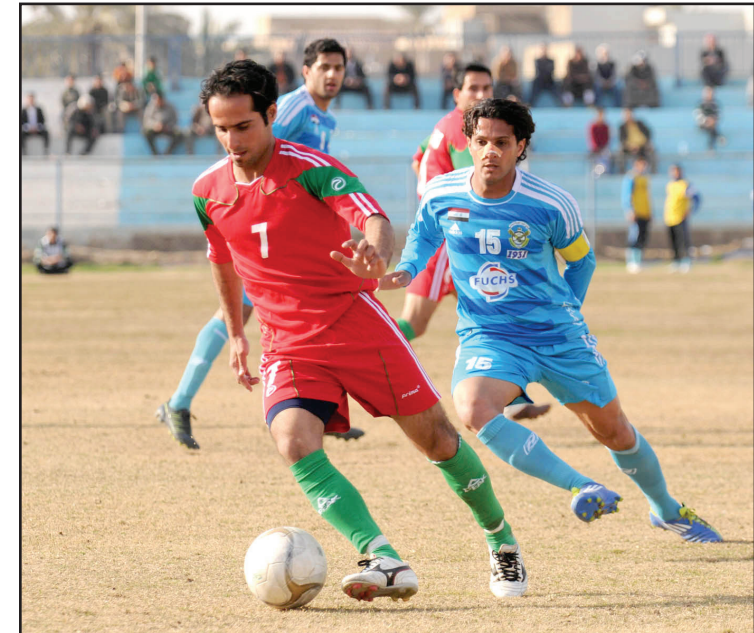
تجدد الاثارة في دوري النخبة

ويواجه بغداد ضيفه كربلاء اليوم ايضا على ملعب الاول في العاصمة وكلاهما يطمحان بفوز يحسنان به مشواريهما وتعديل نتائجهما خصوصاً الضيوف. ويشغل بغداد المركز السابع برصيد ٤٤ نقطة بينما يحتفظ كربلاء برصيد ٢٢ نقطة في التسلسل الرابع عشر. ويواجه الصناعة في ملعب كركوك مهمة الاخير على صاحب الارض والجمهور . ويمتلك الصناعة ٣٥ نقطة في المركز الثاني عشر مقابل ٣٦ نقطة لمنافسه كركوك. وكان كركوك قد تغلب على النجف في مقر دار الاخير بهدفين مقابل هدف واحد. وتختتم المرحلة الحادية والثلاثون غداً الثلاثاء باقامة مباراتين منتظرتين الاولى يلتقي فيها المتصدر أربيل مع الكرخ وفي الثانية التي تقام في ملعب زاخو يواجه الطلبة مضيفة في مباراة لا تقل اهمية عن سابقتها.